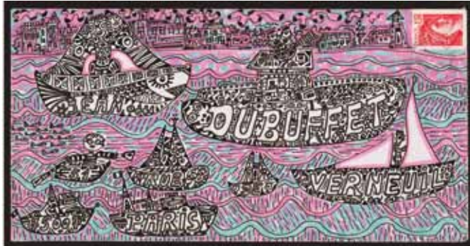
Alain pauzié, sans titre , 1979, encre et surligneur sur papier, 11,2 x 22 cm, collection de l'Art brut, Lausanne.