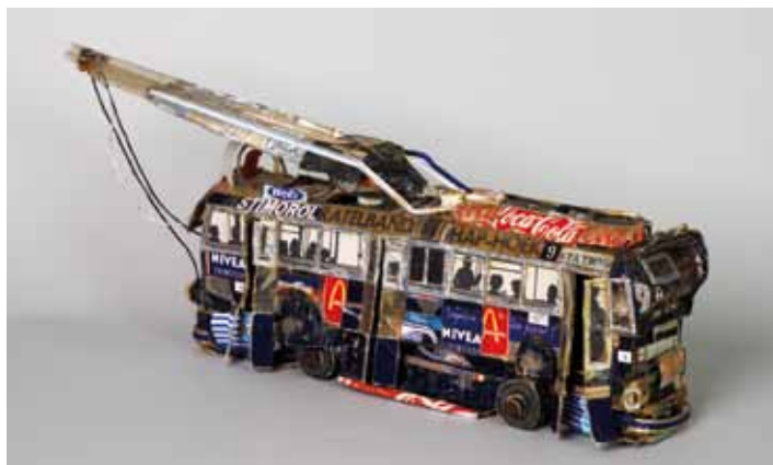
Willem van Genk, sans titre , s.d., assemblage de matériaux de récupération divers, 61 x 14 x 25 cm, collection de l'Art Brut, Lausanne.