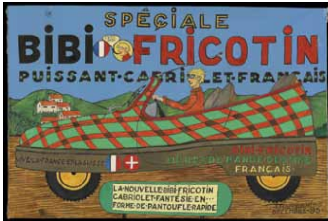
Jean turlonias, spéciale Bibi Fricotin , 1995, huile sur toile, 66,5 x 100 cm, collection de l'Art brut, Lausanne.