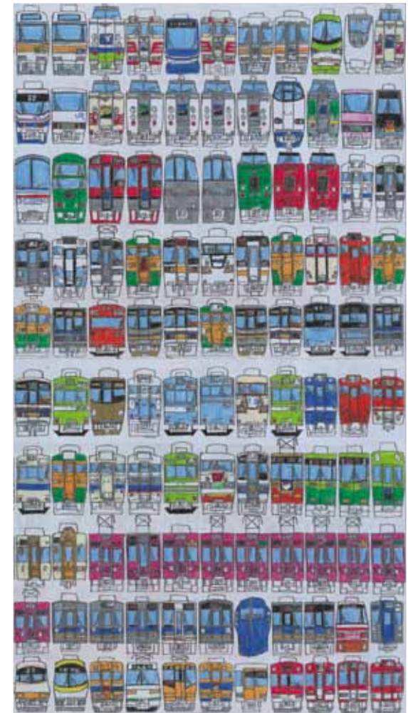
Hidenori Motooka, trains 3 , 1995, mine de plomb et crayon de couleur sur papier 36,5 x 26 cm, collection de l'Art Brut, Lausanne.