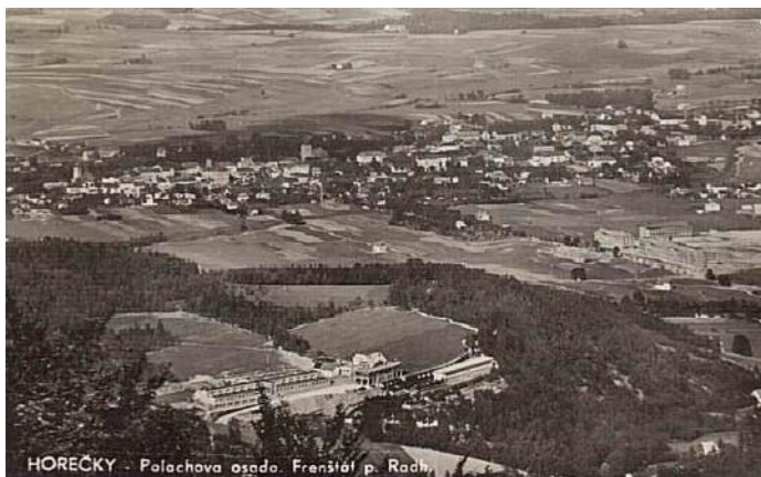
Horečky - Polachova osada

Město Frenštát pod Radhoštěm, jak již napovídá samotný název, se rozkládá pod Radhoštěm, jedním z vrcholů pohoří Moravskoslezských Beskyd a protéká jím řeka Lomná. Už na konci 19. století byl propojen s důležitými hospodářskými centry železniční tratí, což přineslo městečku velký rozmach. Tradici textilního