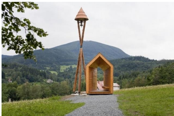
Zvonice od architekta K.Mrvy, Horečky

průmyslu z 19. století vystřídal po druhé světové válce průmysl strojírenský a to díky novému záводу MEZ, který vyráběl elektromotory a dodnes přináší městu a jeho okolí spoustu pracovních příležitostí v podobě firem Siemens a Continental.