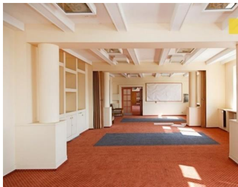
Interiér hotelu Vlčina

citlivě včlenila do krajiny. Stávající stavby mezi Mariánkou a Pantátou chtěl odstranit a oba objekty výhodně propojit architektonickou pergolou. Pod Mariánkou dále navrhl dlouhou kolonádu a v místech