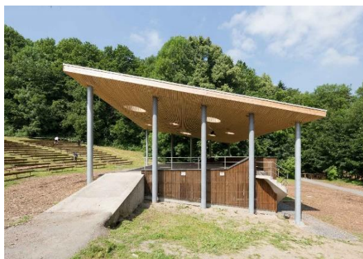
Amfiteátr, rekonstrukce K.Marva, Horečky

veškeré pohodlí moderní doby (velká restaurace, herna, bar, pokoje s příslušenstvím i garáže pro auta).