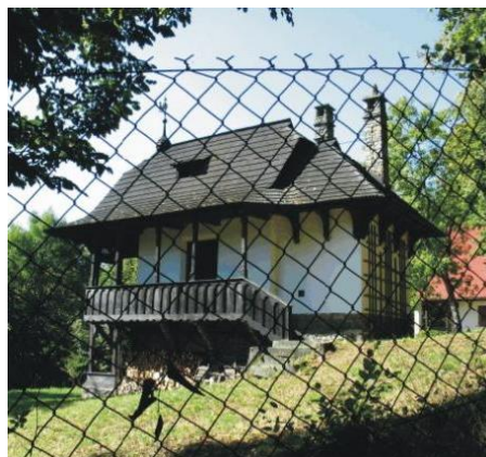
Dušan Jurkovič, Sušírna ovoce, Horečky

Určitě by stálo za zmínku, že se na Horečkách realizoval také Dušan Jurkovič stavbou, která je prostorovou skicou daleko slavnějších staveb na nedalekých Pustevnách. Útulny a další drobná architektura na Pustevnách, 6 které jsou