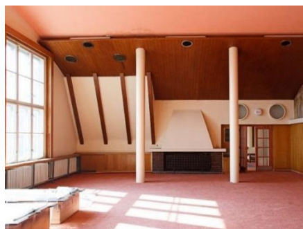
Interiér hotelu Vlčina

1940 realizoval a tím byl Hotel Vlčina. Přestože stavba svou vnější formou dokonale zapadá do tvarosloví staveb v Beskydské krajině, už na první pohled v detailech napovídá, že se jedná o dílo velkého architekta, který za nenápadnou fasádu ze dřeva a kamene a pod tradiční sedlovou střechu schoval dokonale vzdušné interiéry, které návštěvníkům skýtaly