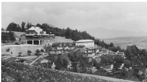
Hotel Pantáta, penzióny Panímáma, Mariánka