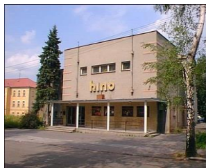
O. Poříška, Kino, Frenštát/R.

Fuchs také vytvořil několik variant obytných domů s malými byty, z nichž byly realizovány a dodnes stojí trojdomy na Beskydském sídlišti. Jednoduchý