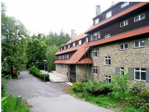
Hotel Vlčina od B. Fuchse, Horečky

Šlapetové dřevěný hotel, citlivě zasazený do hornaté beskydské krajiny, jejich návrh bohužel realizován nebyl. 2