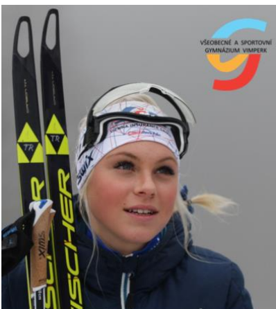
Tři nominace na mistrovství světa, jedna na olympiádu.