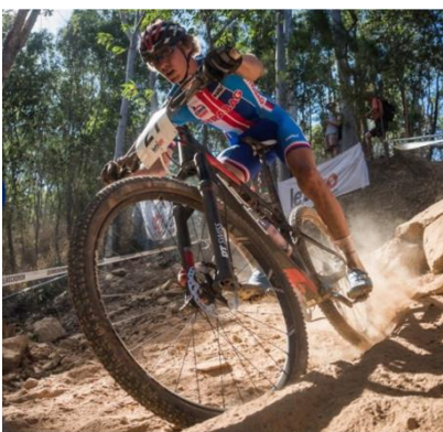
Studují u nás reprezentanti ČR.