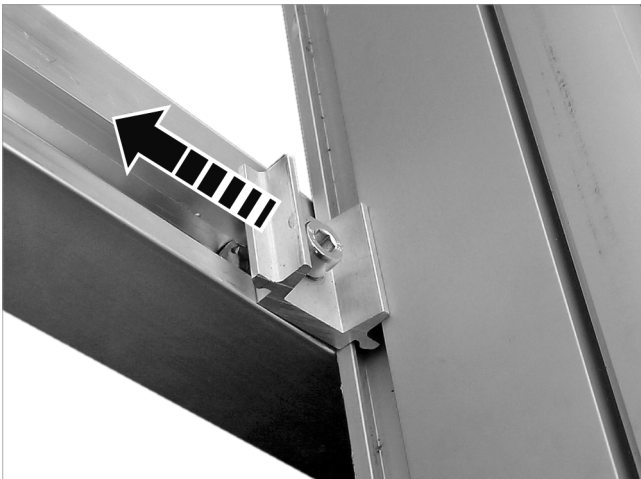
Abb. 1: Alte Kollektoren zusammen mit den Mittelklemmen entfernen