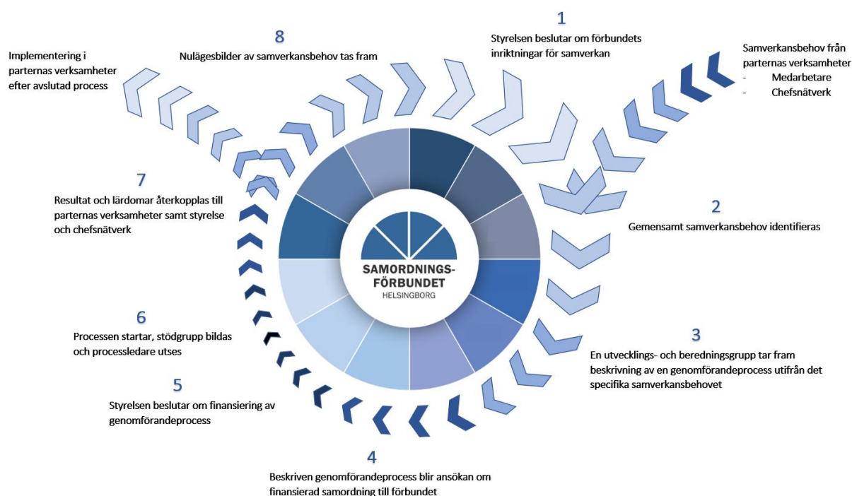
Verksamhetsprocessen inom Samordningsförbundet Helsingborg (bilaga 1)

Strukturen för samordningsförbundets arbete ska ge en översikt av förbundets verksamhet och dess arenor för samverkan. Genom en välfungerande struktur och verksamhetsprocess säkerställs att förbundets fokusområden och inriktningar möter parternas behov och prioriteringar, vilket ska leda till att samtliga parter ser värde och effekter av förbundets insatser.