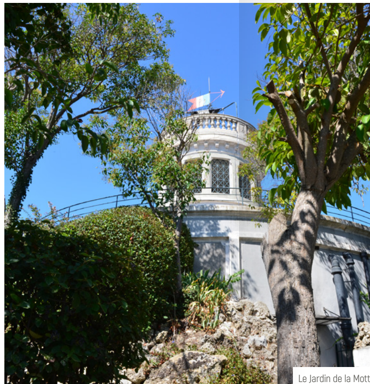
Le Jardin de la Motte

Et de l'autre côté, votre regard se porte sur un horizon bleu : l'Étang de l'Or est tout proche. Mauguio est aussi une station balnéaire de renom , grâce à son rapprochement avec Carnon. Ses plages et son port de plaisance accueillent ainsi chaque année de nombreux touristes, venus profiter de la chaleur et de la douceur de vivre méditerranéenne.