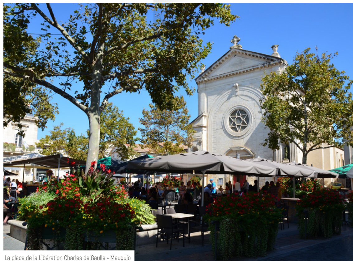
La place de la Libération Charles de Gaulle - Mauguio