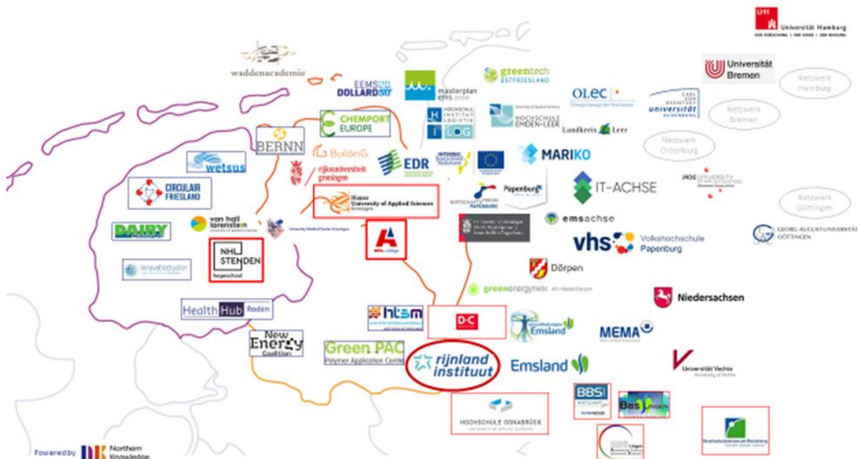
Afbeelding 1. Weergave noordelijke kennisinfrastructuur.

De naam van het Rijnland Instituut is geënt op het gedachtegoed van het Rijnlandse model, dat als tegenhanger geldt van het Angelsaksische model gestoeld op het neoliberalisme van de vrije markt. Met het Rijnlands model als inspiratiebron bevordert het instituut het grensoverschrijdend opleiden en werken. Het Rijnlands model benadrukt het belang van het overleg met alle betrokkenen ('stakeholders') en gaat uit van een lange termijn perspectief. Deze sociale marktbenadering staat voor een cultuur waarbij met de verschillende partijen en stakeholders rekening wordt gehouden, voor solidariteit, voor waardering voor vakmanschap en voor andere waarden dan alleen geld, zoals kwaliteit en geluk.