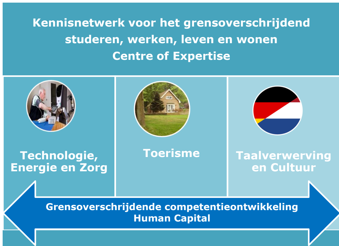
Afbeelding 2. Weergave prioriteiten Rijnland Instituut.

Schematisch zien de prioriteiten er als volgt uit: