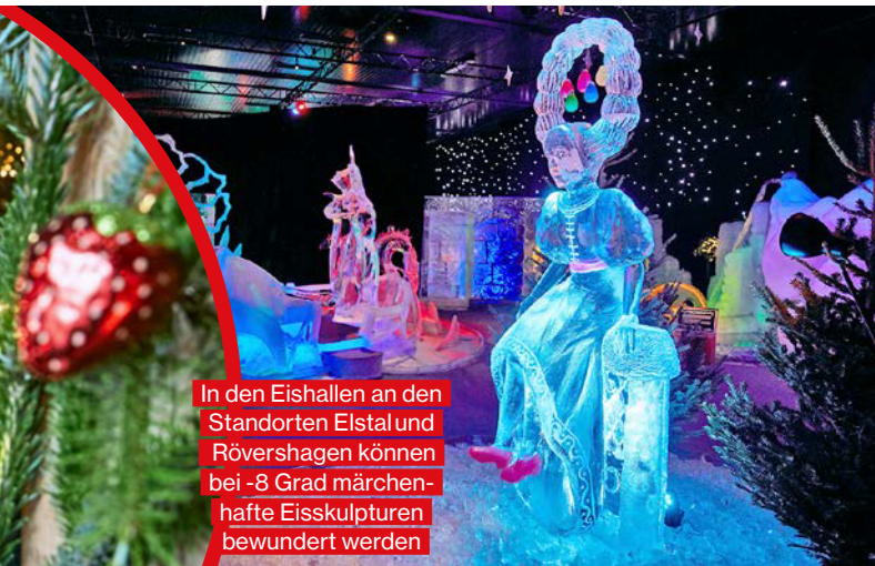
In den Eishallen an den Standorten Elstal und Rövershagen können bei -8 Grad märchenhafte Eisskulpturen bewundert werden