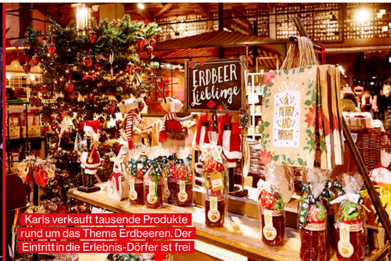
Karls verkauft tausende Produkte rund um das Thema Erdbeeren. Der Eintritt in die Erlebnis-Dörfer ist frei