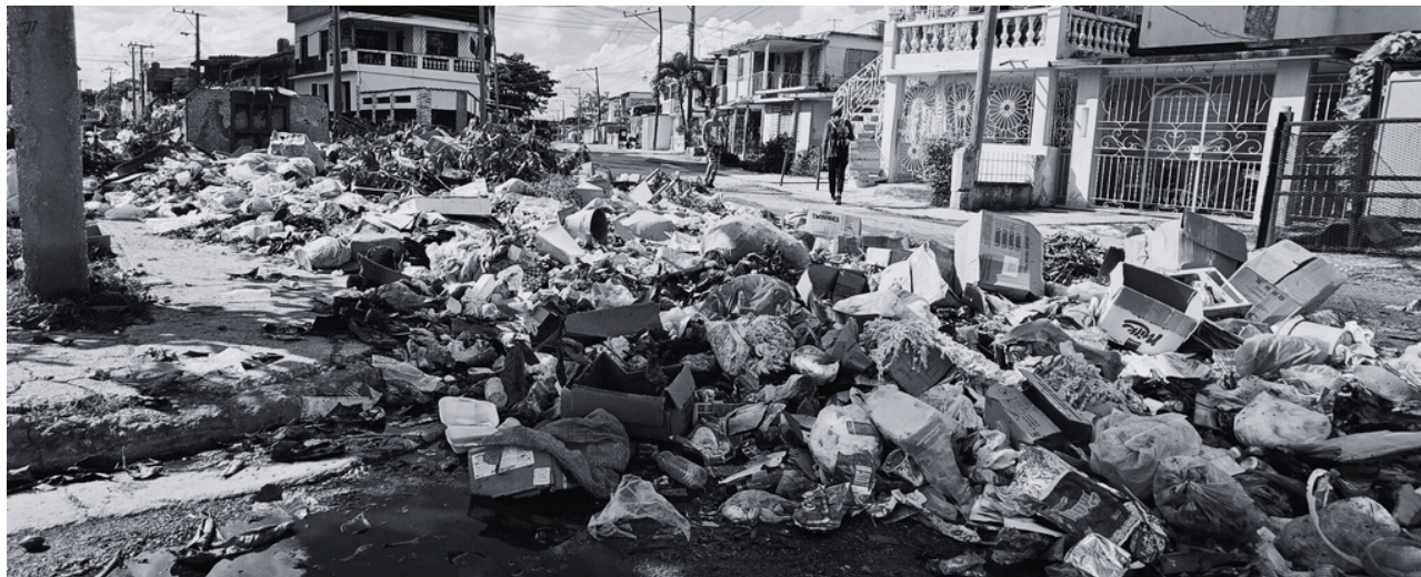
FOTO: BASURERO EN LA CIUDAD DE CAMAGÜEY.

Una de las áreas en la que más repercuten los apagones, junto al colapso de los servicios de recogida de basura , es en la proliferación de las arbovirosis transmitidas por mosquitos. Aunque las autoridades sanitarias hablan de control de la epidemia y solo informan de 50 mil contagios y 55 fallecidos , las denuncias provenientes de la ciudadanía e informes de organizaciones internacionales muestran un cuadro mucho más extendido, letal y complejo. Son frecuentes los reportes de contagios de turistas que visitan la Isla y varios países han emitido alertas a sus nacionales sobre los viajes a Cuba. Todo esto, con un sistema de salud en crisis, donde escasea el personal , los medicamentos e insumos , las infraestructuras se encuentran en estado calamitoso y la atención es mala .