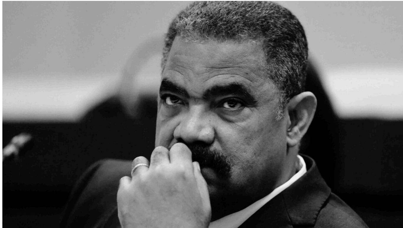
FOTO: RUBÉN REMIGIO FERRO, PERPETRADOR DE MÚLTIPLES VIOLACIONES DE DERECHOS POR MÁS DE DOS DÉCADAS DESDE SU PUESTO DE PRESIDENTE DEL TRIBUNAL SUPREMO POPULAR.

sumándose al ejército ruso, mientras que La Habana votó en la ONU contra una resolución que exigía la devolución de los niños ucranianos deportados ilegalmente a Rusia. Cuba figuró entre los países señalados por la Policía Nacional de España como parte de un esquema internacional para desviar fondos públicos. Por otra parte, el gobierno de Antigua y Barbuda puso fin al convenio de “cooperación de salud” que mantenía con La Habana.