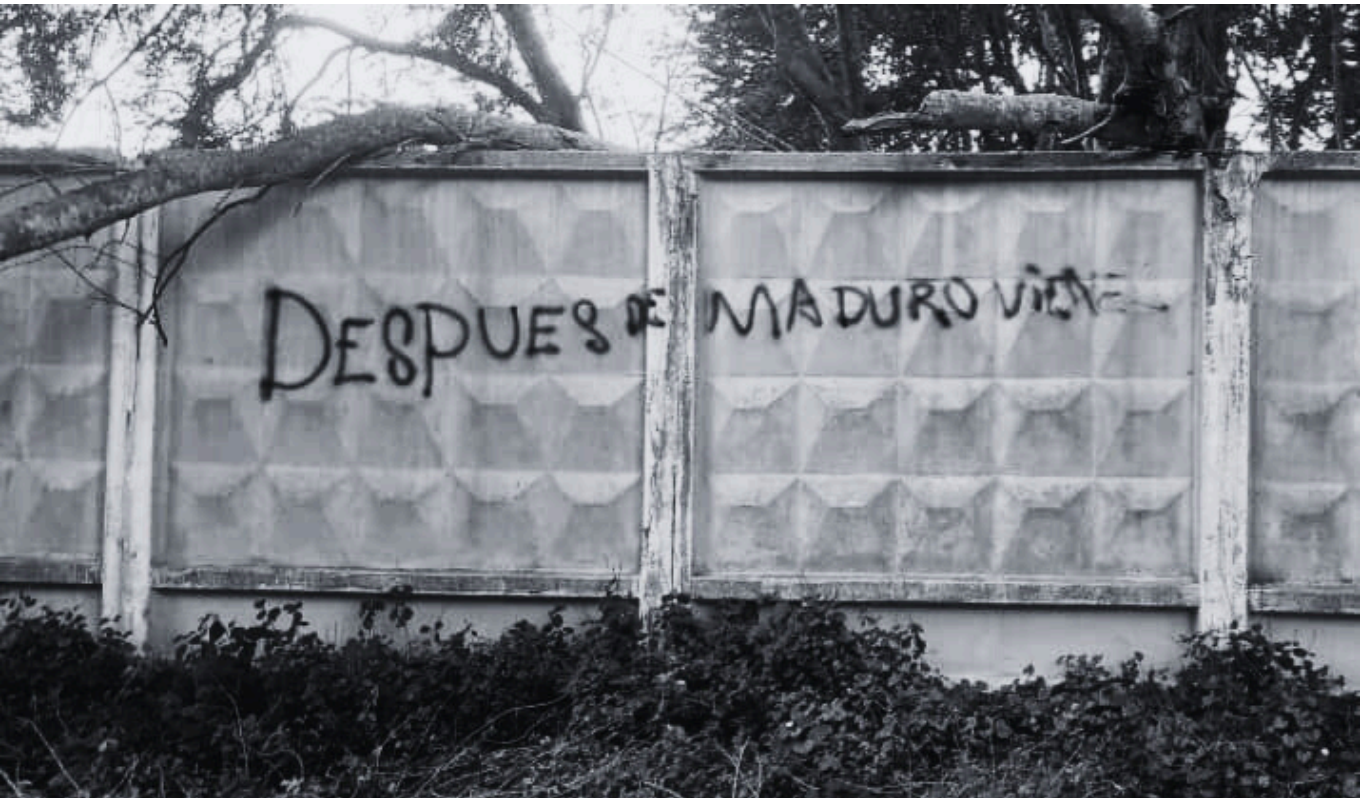
FOTO: PINTADA EN LA UNIVERSIDAD DE CIENCIAS MÉDICAS DE CAMAGÜEY.