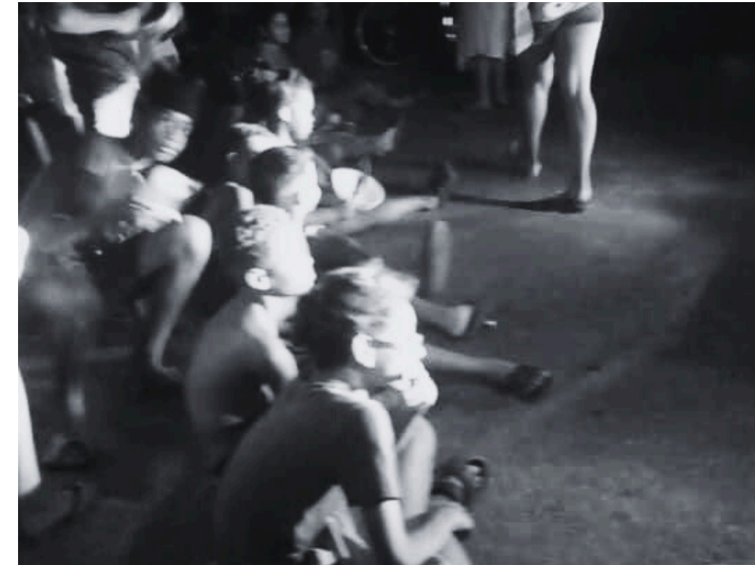
FOTO: UN GRUPO DE PERSONAS, INCLUIDOS NIÑOS, CIERRAN LA CALLE MONTE EN PROTESTA POR LOS APAGONES.

En el contexto del paso del huracán Melissa, el régimen cubano anunció un nuevo paquetazo económico que incluye eliminación de subsidios, aumento de precios, nuevos impuestos y más dolarización; y también informó sobre la imputación de cargos al ex