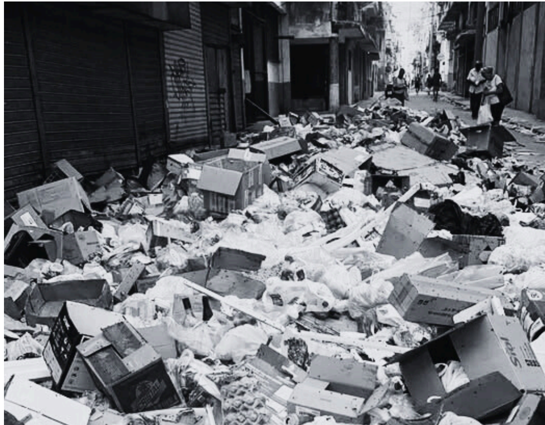
FOTO: BASURERO AL LADO DE LA TIENDA LA ÉPOCA, LA HABANA.

Las manifestaciones de inconformidad ante estas problemáticas generalmente derivan en represión por parte de agentes estatales. Durante el mes, Cubalex registró 34 protestas, consistentes fundamentalmente en carteles antigubernamentales , salida a las calles , cacerolazos y cierre de vialidades .