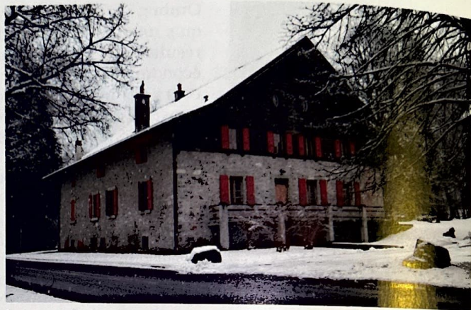
La ferme de Dorigny.