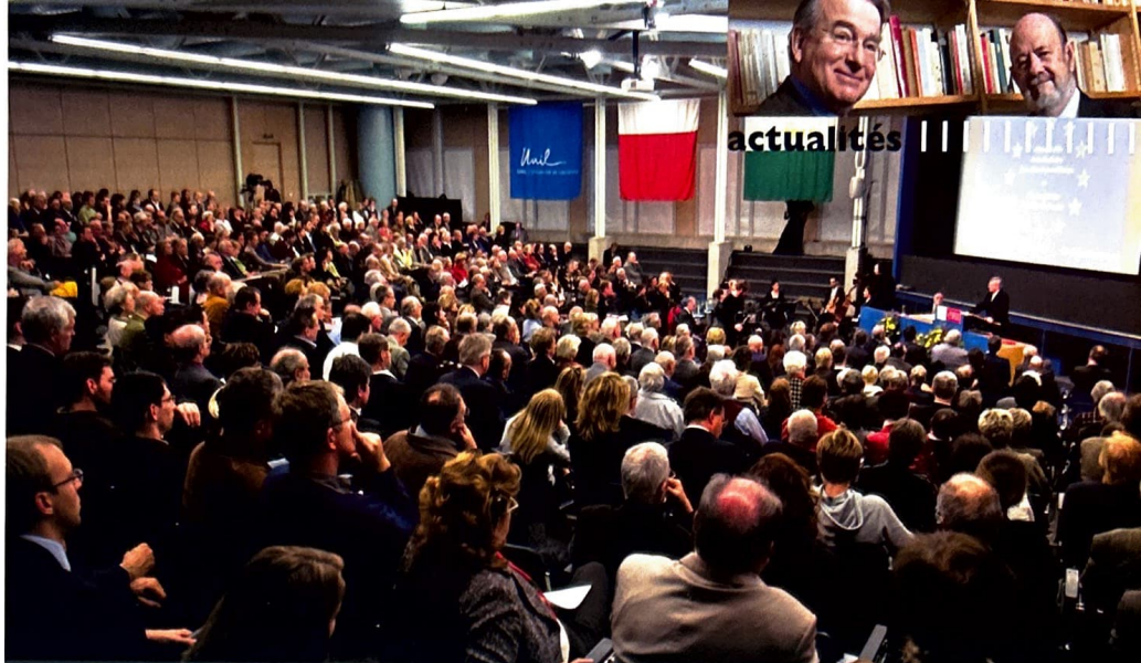
Remise de la Médaille d'or de la Fondation à Jean-Claude Juncker.