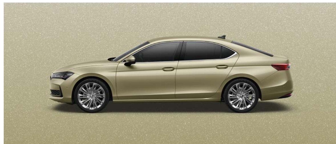
Ice Tea Yellow