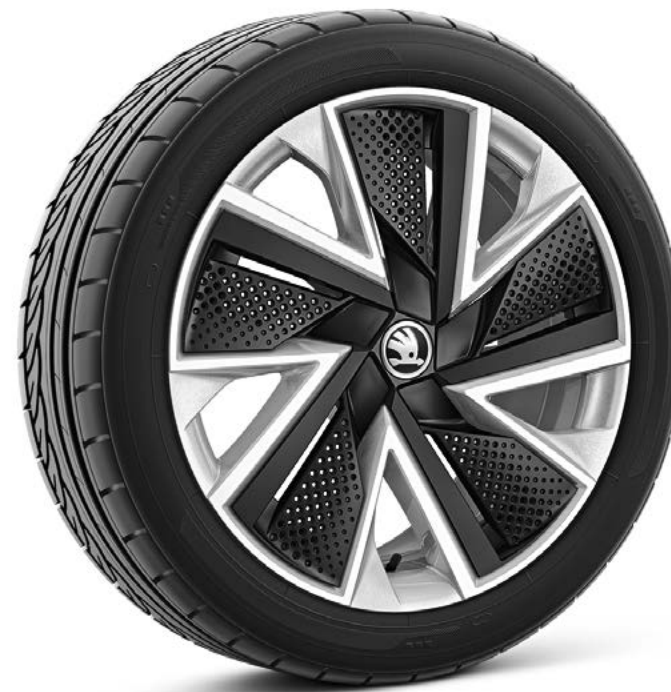
18" Bosona zilver