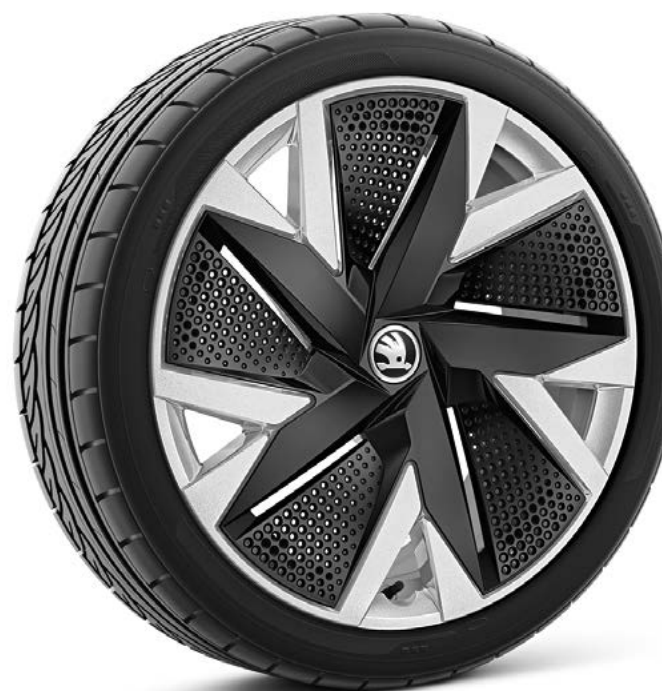
19" Aniara Aero zilver