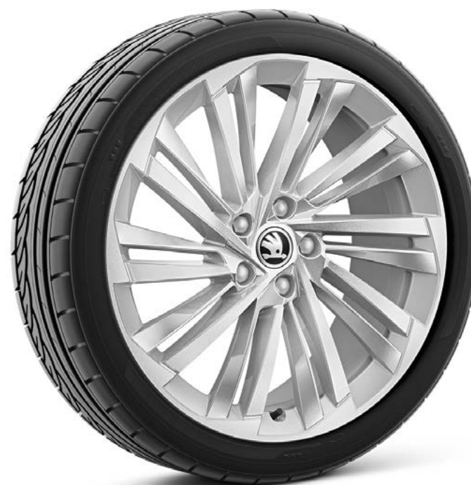
19" Veritate zilver