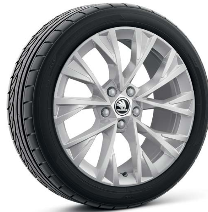
18" Dofida zilver