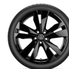
Bergen in zwart