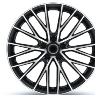
Stijl 9 zwart gepolijst

Consumentenadviestarieven zijn inclusief btw en zijn hier weergegeven zoals bekend op 1 januari 2026. Prijzen van producten met montage kunnen afwijken per dealer.