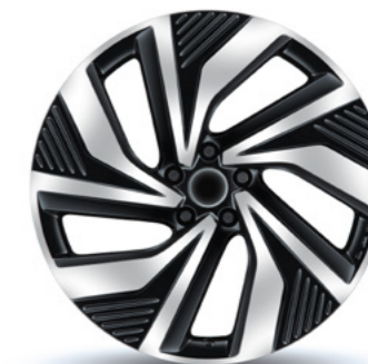
Stijl 4 zwart gepolijst