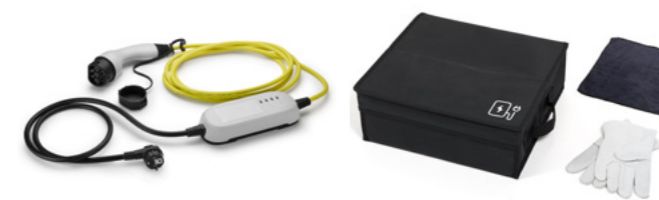
Laadkabel Type 2