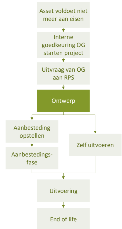
Figuur 2: Ketenstappen opdracht RPS

Deze ketenanalyse zal zich richten op de reductiepotentie is die te behalen valt in de ontwerpfase. De analyse zal gemaakt worden op basis van een ontwerp met stalen damwanden, omdat deze damwanden heeft meest gebruikt worden in de ontwerpen van RPS.