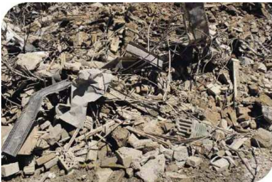
Bouw- en sloopafval (KLOK Containers)