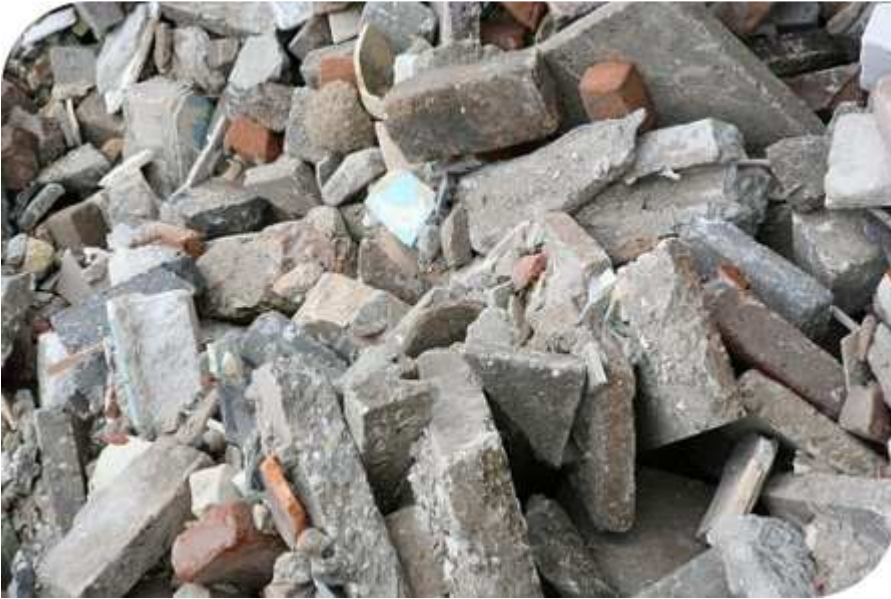
Puinafval (Klok Containers)