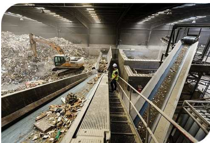
Sorteerinstallatie van KLOK Containers

Deze ketenanalyse richt zich op de inzameling en scheiding van afval op de bouwplaats van BVR Groep BV, het transport en de verdere verwerking van het afval.