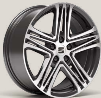
Performance FBI FPH PUM