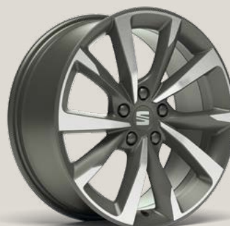
Performance FBI FPH PUK