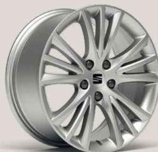
Dynamic St PUA