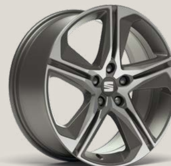
Performance 2 FBI FPH PUN