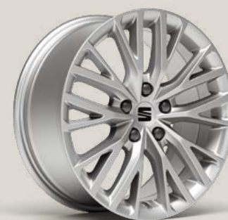
Performance St PUB