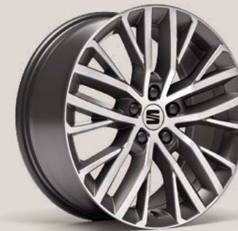
Performance FBI PUP