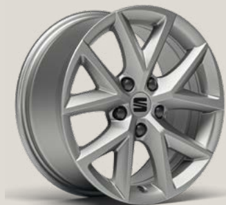
Urban R St