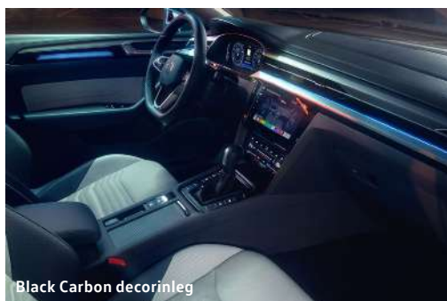
Black Carbon decorinleg