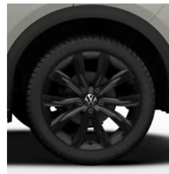
Grange Hill zwart