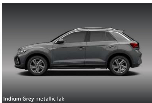
Indium Grey metallic lak