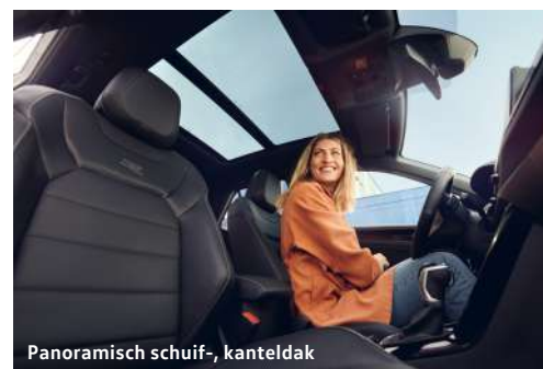
Panoramisch schuif-, kanteldak

Zelfs in het donker is de T-Roc een opvallende verschijning. De IQ.LIGHT LED Matrix koplampverlichting zorgt er namelijk voor dat jij niet te missen bent en altijd optimaal zicht hebt. Zonder andere weggebruikers te verblinden. Daar zorgt de Dynamische grootlichtassistent 'Dynamic Light Assist' voor.