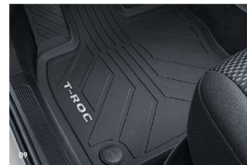
09 Volkswagen rubberen all-weather mattenset - Vóór € 55 Art.nr. 2GA061502 82V - Voor en achter € 100 Art.nr. 2GA061500 82V