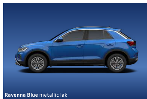
Ravenna Blue metallic lak