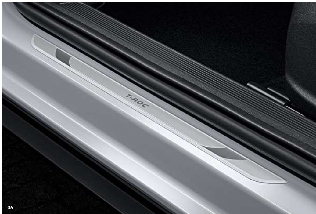
06 Volkswagen instaplijsten - Voorportieren - Aluminium voorzien van T-Roc opschrift Art.nr. 2GA071303

Kijk voor de actuele prijzen en acties op shop.volkswagen.nl