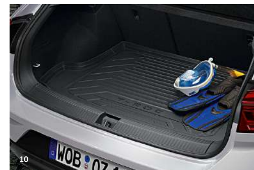
10 Volkswagen kofferbakmat € 75 Voor variabele laadbodem Art.nr. 2GA061161