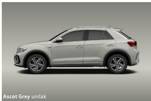
Ascot Grey unilak