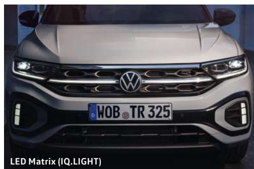
LED Matrix (IQ.LIGHT)

Zelfs in het donker is de T-Roc een opvallende verschijning. De IQ.LIGHT LED Matrix koplampverlichting zorgt er namelijk voor dat jij niet te missen bent en altijd optimaal zicht hebt. Zonder andere weggebruikers te verblinden. Daar zorgt de Dynamische grootlichtassistent 'Dynamic Light Assist' voor.