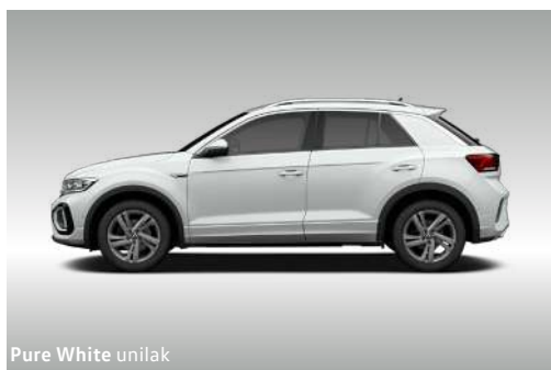
Pure White unilak