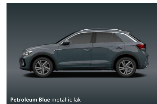
Petroleum Blue metallic lak