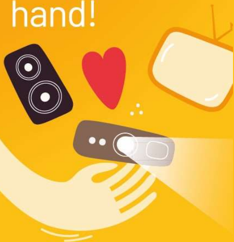
2e hands audio-visuele apparatuur