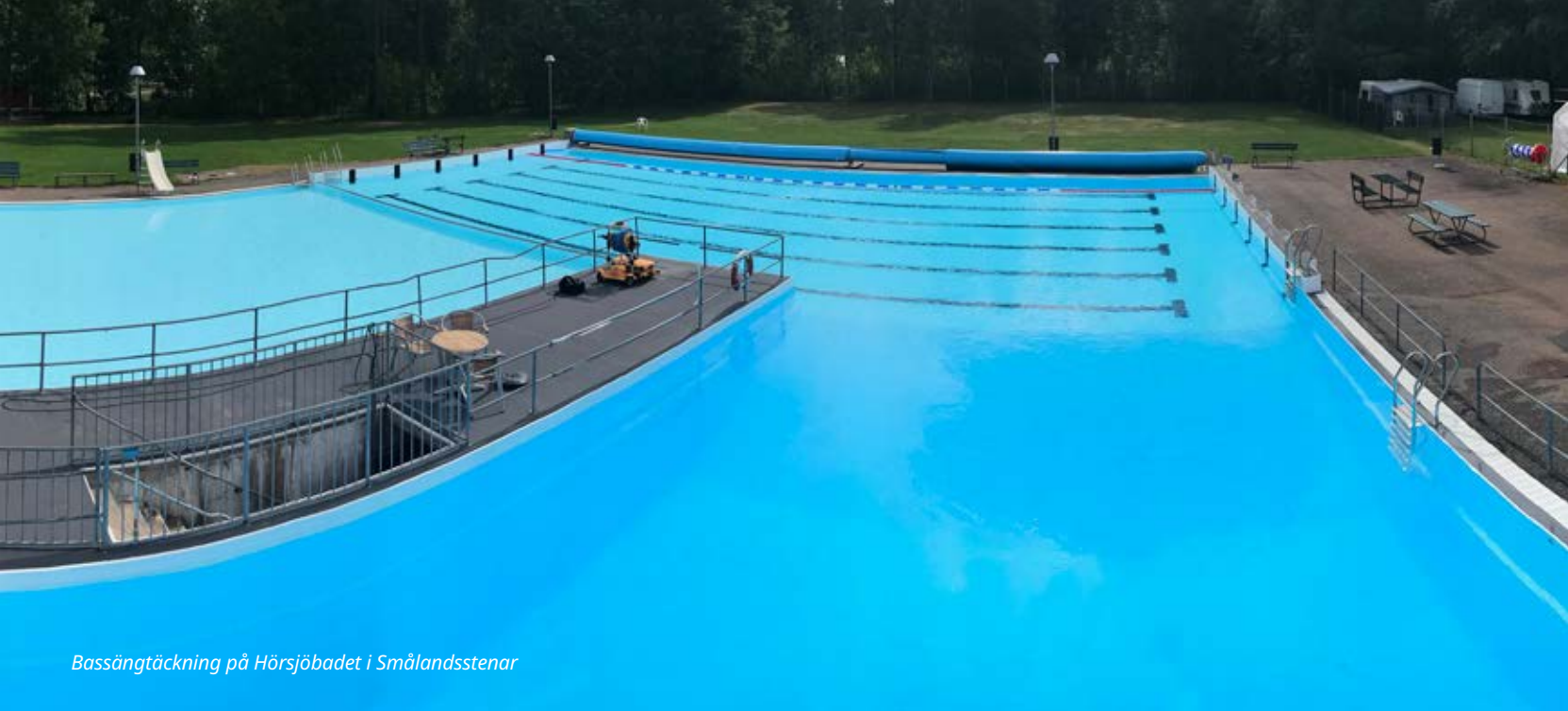
Bassängtäckning på Hörsjöbadet i Smålandsstenar