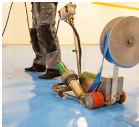
Varmluftssvetsning av bassängtäcke