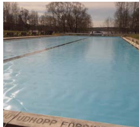
Bassängtäckning - Kvarnbadet i Vallentuna