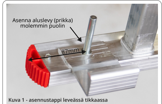
Kuva 1 - asennustappi leveässä tikkaassa