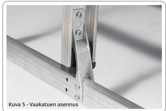
Kuva 5 - Vaakatuon asennus