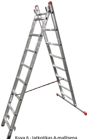
Kuva 6 - Jatkotikas A-mallisena

Kiinnitä rajoitinhihna molempien tikkaiden 6-ylimpään vaakapienaan.