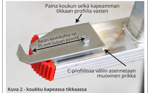
Kuva 2 - koukku kapeassa tikkaassa