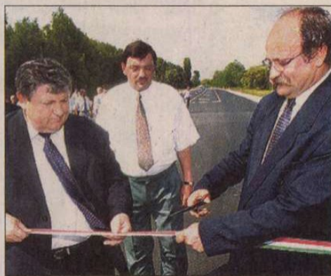
A régóta várt pillanat

si Hadsereg (UCK) gerillái. A NATO hét napot adott a teljes kivonásra, és jelezte: a légitámaszpontokat csak akkor állítják le, ha a kivonás már legalább egy napon át, ellenőrizhetően zajlik. NATO-tisztviselők szerint a katonai szövetség Macedóniában állomásozó csapatai a megállapodás aláírásától számított kevesebb mint 48 órán belül képesek behatolni Koszovó területére.