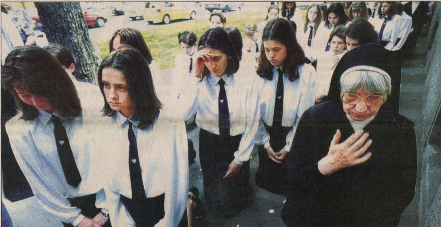
Ürnap körmenet vonult végig Debrecen belvárosában vasárnap délelőtt. A Szent Anna római katolikus székesegyház látványos rituáléján a gyülekezet több száz tagja vett részt