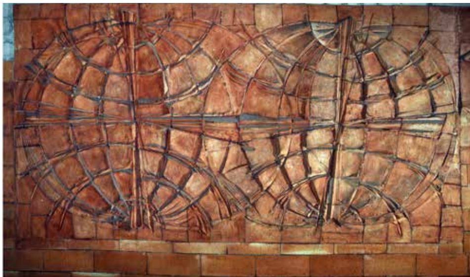
Közlekedési Múzeum – dombormű (részlet), 60 m 2 terrakotta, 1966