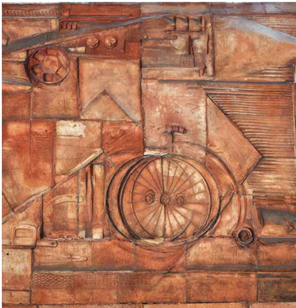
Közlekedési Múzeum – dombormű (részlet), 60 m 2 , terrakotta, 1966