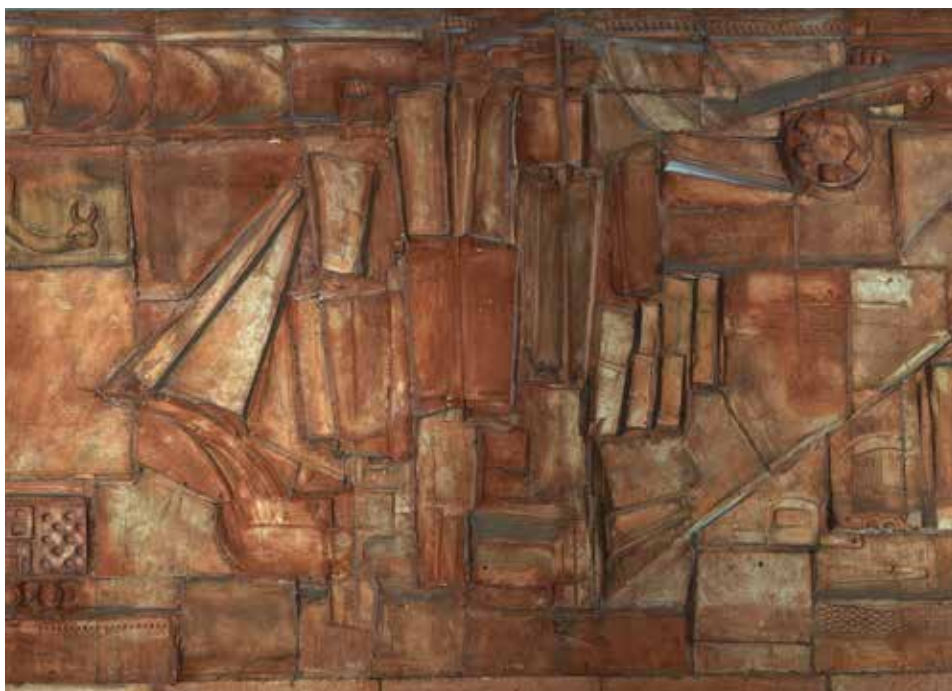
Közlekedési Múzeum – dombormű (részlet), 60 m 2 terrakotta, 1966