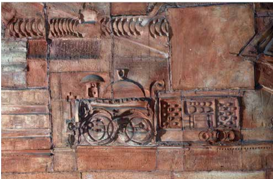
Közlekedési Múzeum – dombormű (részlet), 60 m 2 terrakotta, 1966