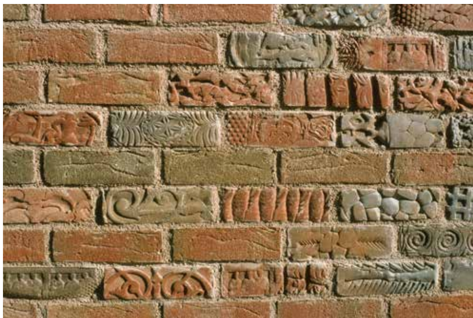
Porcelánium, Herend – mintás téglák a burkolatban