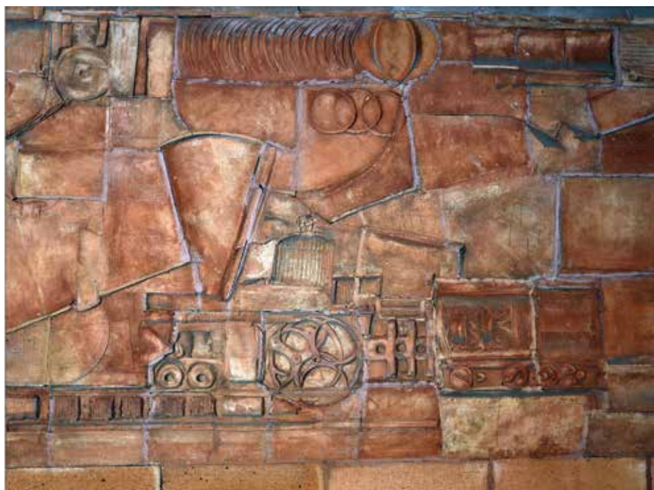
Közlekedési Múzeum – dombormű (részlet), 60 m 2 , terrakotta, 1966