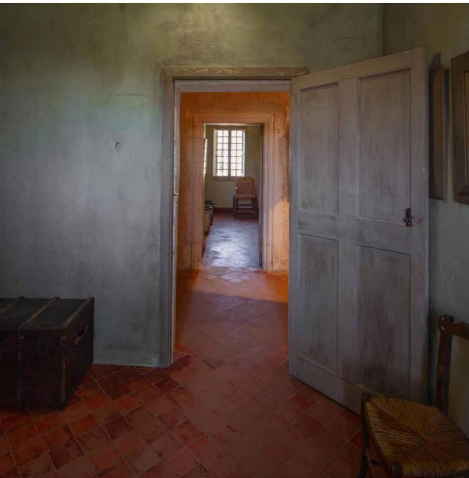
Foto uit de Brabantse periode van Van Gogh in Vincent was here

heb veel geleerd en daar gaat het mij ook om: het licht, de kleuren, het meegaan met de seizoenen. Voor mij was het nieuw om landschappen en stillevens te fotograferen. Zo geef ik mijn fotografie weer een andere wending.'