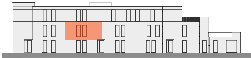
BLOK B - VOORGEVEL