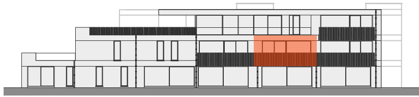
BLOK B - ACHTERGEVEL