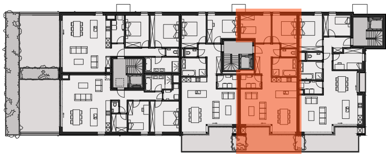
BLOK B - VERDIEPING 1