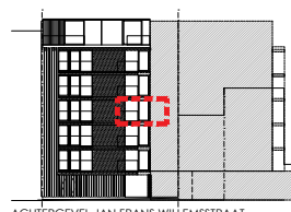
ACHTERGEVEL JAN FRANS WILLEMSSTRAAT