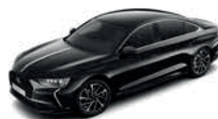
Noir Perla Nera