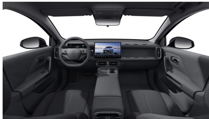
Stoffen bekleding zwart Bestelcode: OCL