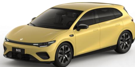
Lightning Yellow (non metallic) €0 Bestelcode: OPA