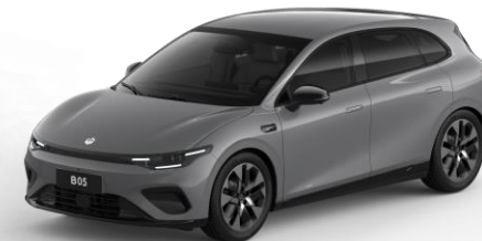
Windy Grey (metallic) €750 Bestelcode: OSA