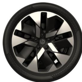
19" lichtmetalen velgen