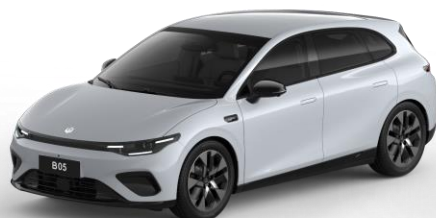
Galaxy Silver (metallic) €750 Bestelcode: ODS