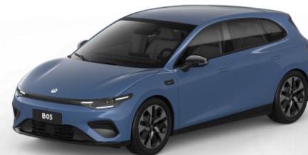
Starry Night Blue (metallic) €750 Bestelcode: OXC