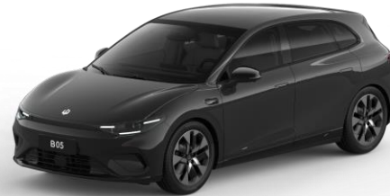
Metallic Black (metallic) €750 Bestelcode: OKL