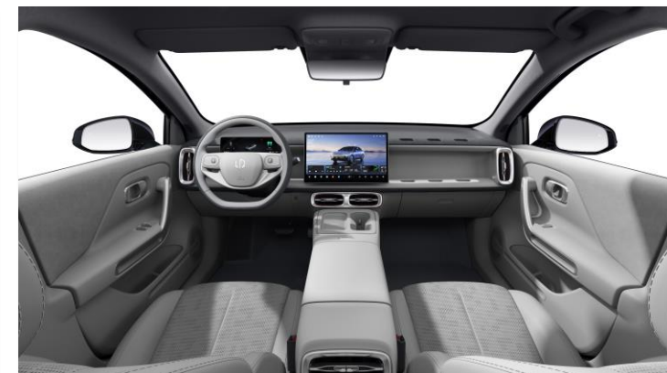
Light Grey Eco Leather Bestelcode: 0XZ