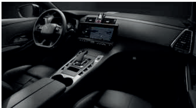
Black Basalt OPERA interieur

● = Standaard ○ = Optioneel - = Niet leverbaar