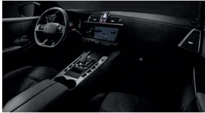
Black Alcantara® interieur