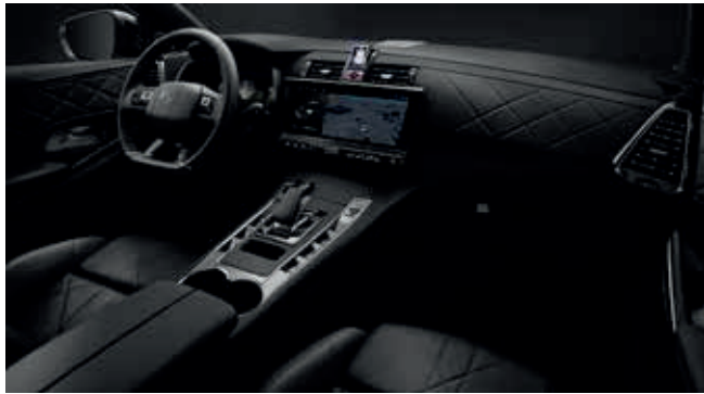
Basalt Black leder interieur