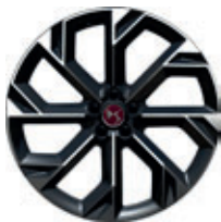
21" BROOKLYN lichtgrijs