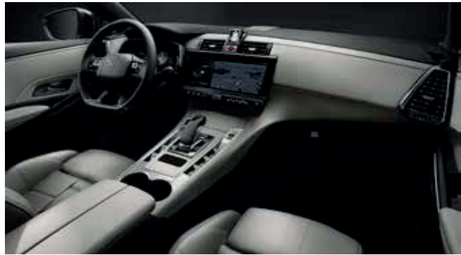
Paerl Grey OPERA interieur