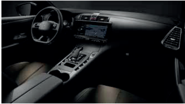
Interieur Perruzi Bronze

Optie BASTILLE+ RIVOLI ESPRIT DE VOYAGE OPERA LA PREMIÈRE PERFORMANCE LINE PERFORMANCE LINE+ Incl. BTW excl. BPM Excl. BTW/BPM J6CR - ○ ● ● ● - - 1400 1157