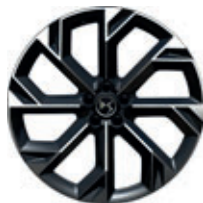
21" BROOKLYN lichtgrijs