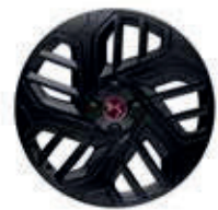
18" lichtmetalen velgen TOULOUSE