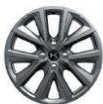
17" lichtmetalen velgen GLASGOW