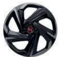
18" lichtmetalen velgen BOSTON