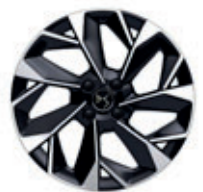
18" lichtmetalen velgen NICE