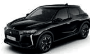
Perla Nera Black