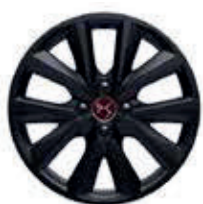
17" lichtmetalen velgen OSLO