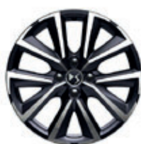
17" lichtmetalen velgen DUBLIN