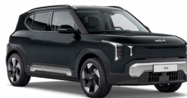
Black Pearl Kleurcode: 1K