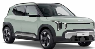
Morning Haze Kleurcode: DM8