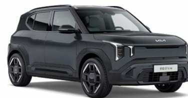
Penta Metal Kleurcode: H8G