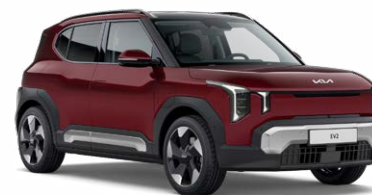
Magma Red Kleurcode: ARD