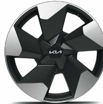
18" lichtmetalen velgen (215/50 R18) Standaard voor Plus en Plus Advanced uitvoeringen