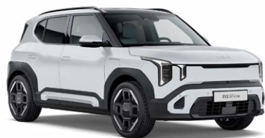
Deluxe White Kleurcode: HW2