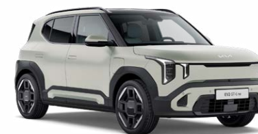
Matte Ivory Silver Kleurcode: IS4