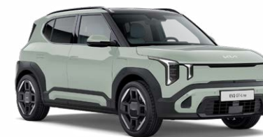
Morning Haze Kleurcode: DM8