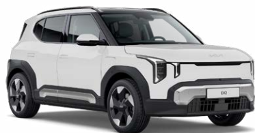
Casa White Kleurcode: WD