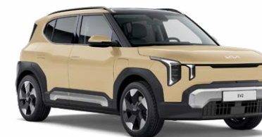
Vanilla Blossom Kleurcode: L3Y