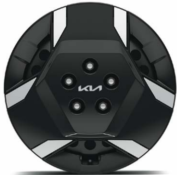
16" stalen velgen met wieldeksel (205/65 R16) Standaard voor Essential uitvoeringen