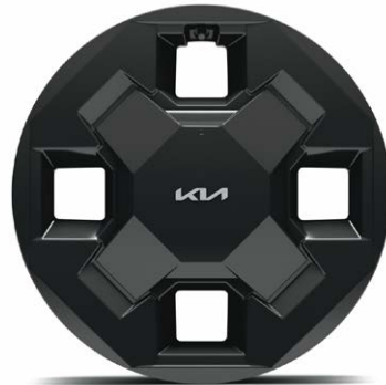
16" lichtmetalen velgen (205/65 R16) Standaard voor Air uitvoeringen