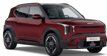
Magma Red Kleurcode: ARD