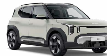
Matte Ivory Silver Kleurcode: IS4