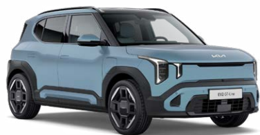
Frost Blue Kleurcode: EBU