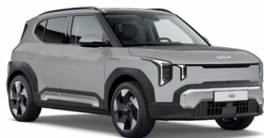
Wolf Grey Kleurcode: WAF