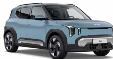
Frost Blue Kleurcode: EBU