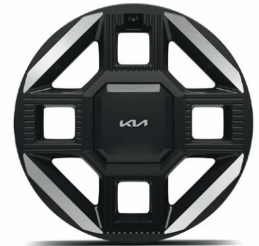
19" lichtmetalen velgen (225/45 R19) Standaard voor GT-Line uitvoeringen