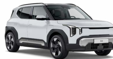
Deluxe White Kleurcode: HW2