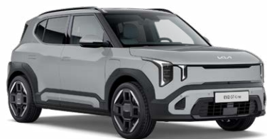
Wolf Grey Kleurcode: WAF