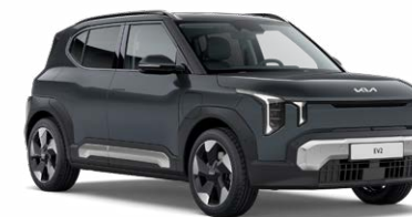
Penta Metal Kleurcode: H8G