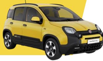
POSITANO YELLOW (effen lak)