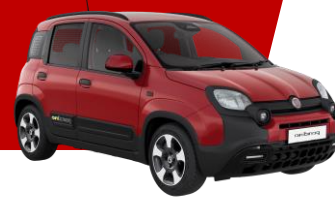
PASSIONE RED (effen lak)