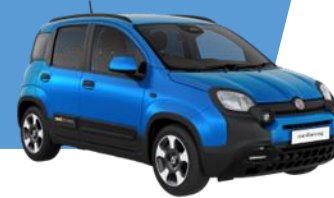
ITALIA BLUE (metallic)