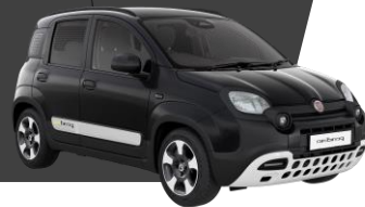
CINEMA BLACK (effen lak)