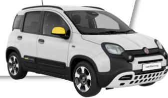
GELATO WHITE (effen lak)