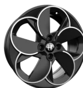
1M5 - 18" Petali