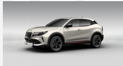
Scala Brown Grey