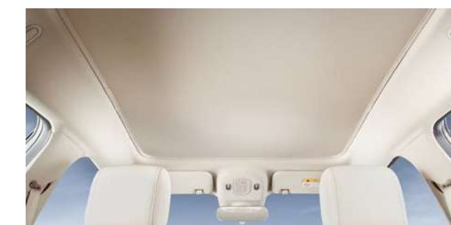
panneau de couverture de toit ouvrant