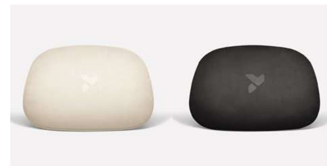
oreiller cervical (beige et noire)