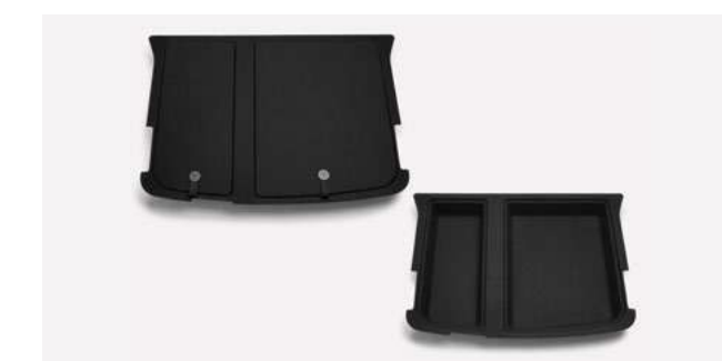
trunk flexible opbergruimte