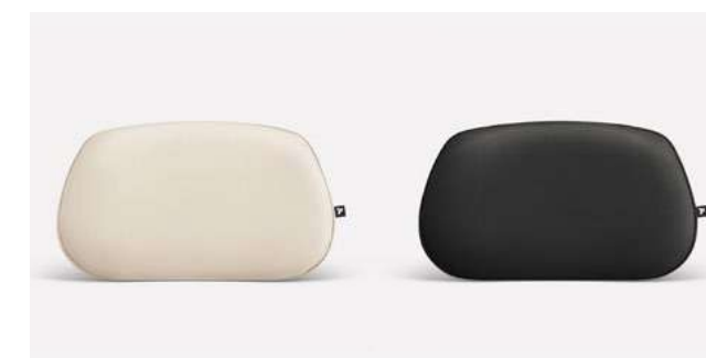
oreiller lumbar (beige et noir)