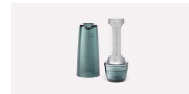
flacon de parfum