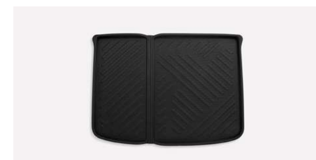
TPR tapis de sol coffre