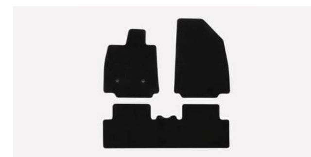
tapis de sol