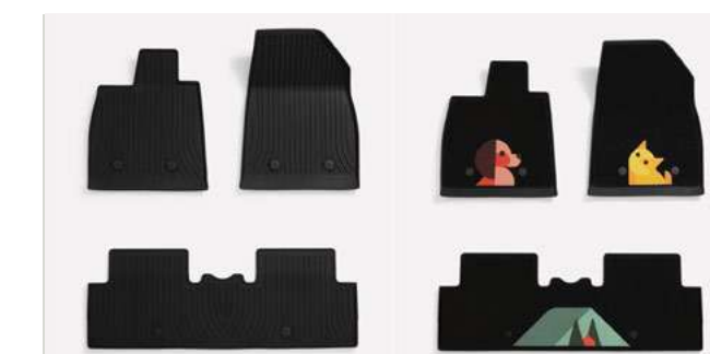
TPE + tapis de sol