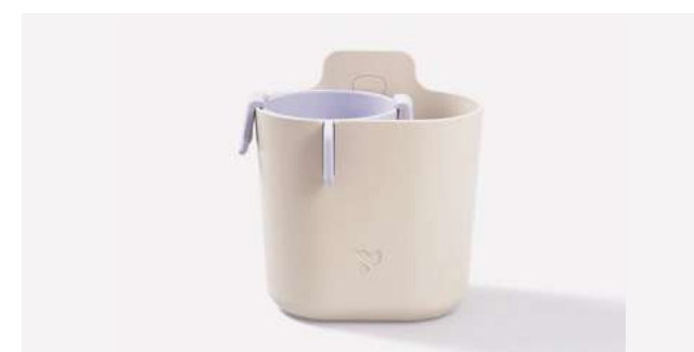
boîte de rangement