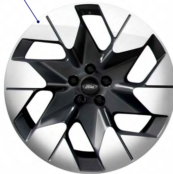
20 inch lichtmetalen velgen met aerodynamisch design in Asphalt Matt / Bright Machined