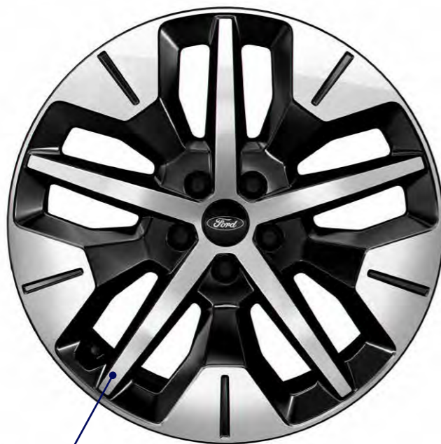
19 inch lichtmetalen velgen Bright Machined/Absolute Black

● = standaard ○ = optioneel – = niet leverbaar