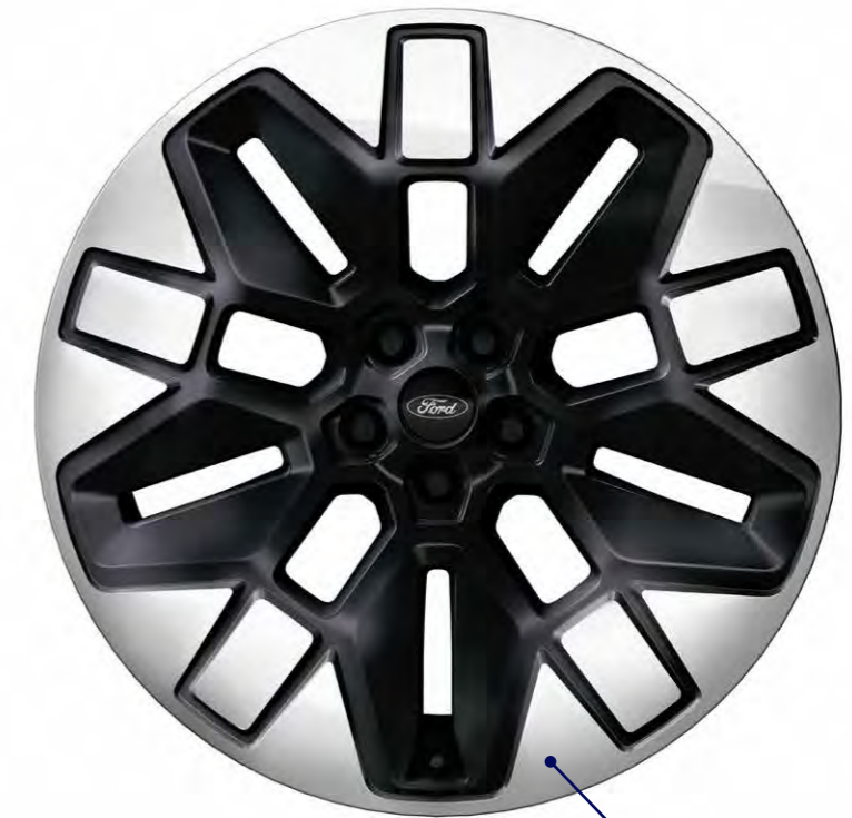
21 inch lichtmetalen velgen met aerodynamisch design in Asphalt Matt / Bright Machined