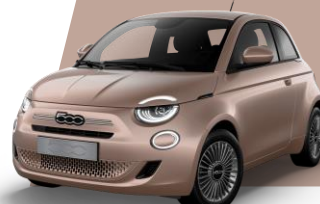
ROSE GOLD (metallic)