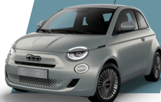
CELESTIAL BLUE (metallic)