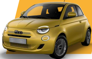
SUN OF ITALY (metallic)