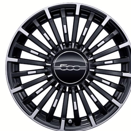
17" lichtmetalen velgen Diamond Cut