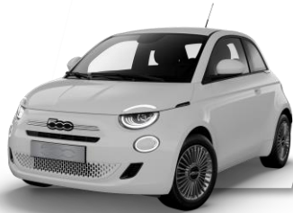
ICE WHITE (effen lak)