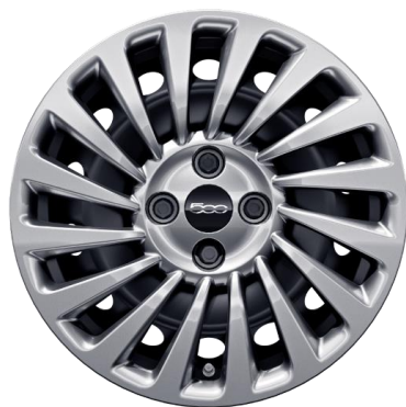
15" stalen velgen met sierdeksel