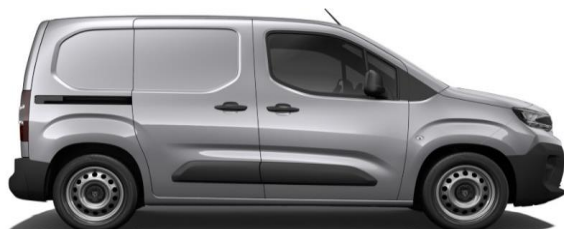
Lichtgrijs Metallic M0F4 € 600 (726)