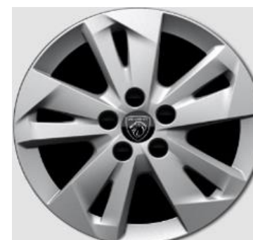
16" Lichtmetalen velgen TARANAKI