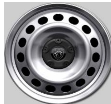
Standaard 16" Wioldoppen