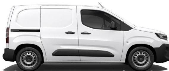
WIT POPR € 0 (0)