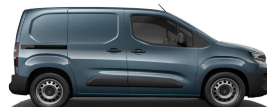
Lichtblauw Metallic M0M6 € 600 (726)