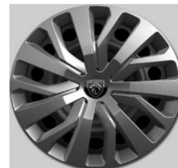
16" volwaardige wioldoppen TONGARIRO (i.c.m. Pakket Comfort Connect Style)