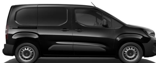
Zwart Metallic M09V € 600 (726)