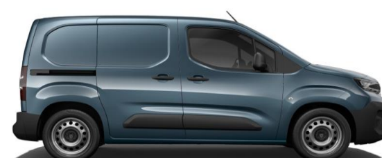
Lichtblauw Metallic M0M6 € 600 (726)