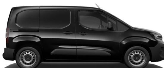
Zwart Metallic M09V € 600 (726)