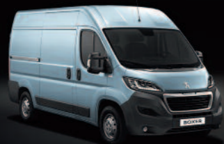
Bleu Lago Azzuro