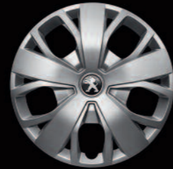
Wielplaat 16" op 400-serie