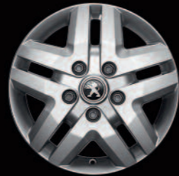
Lichtmetalen velg 16" op 400-serie