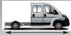
Chassis Dubbele Cabine