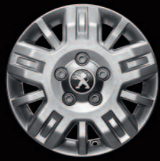
Lichtmetalen velg 15" op 300-serie