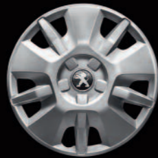
Wielplaat 15" op 300-serie