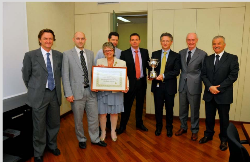
Saipem Innovation Trophy