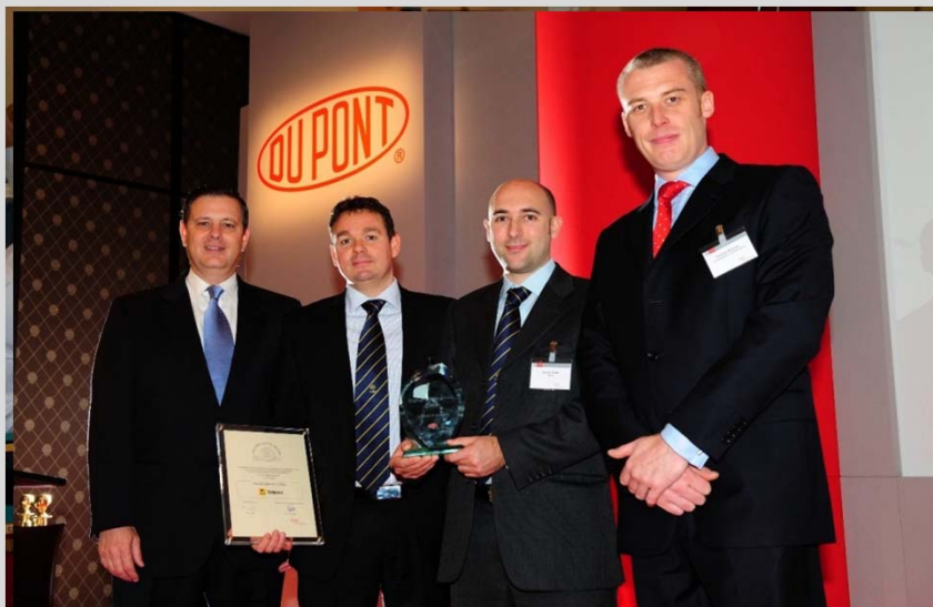
Du Pont Safety Awards