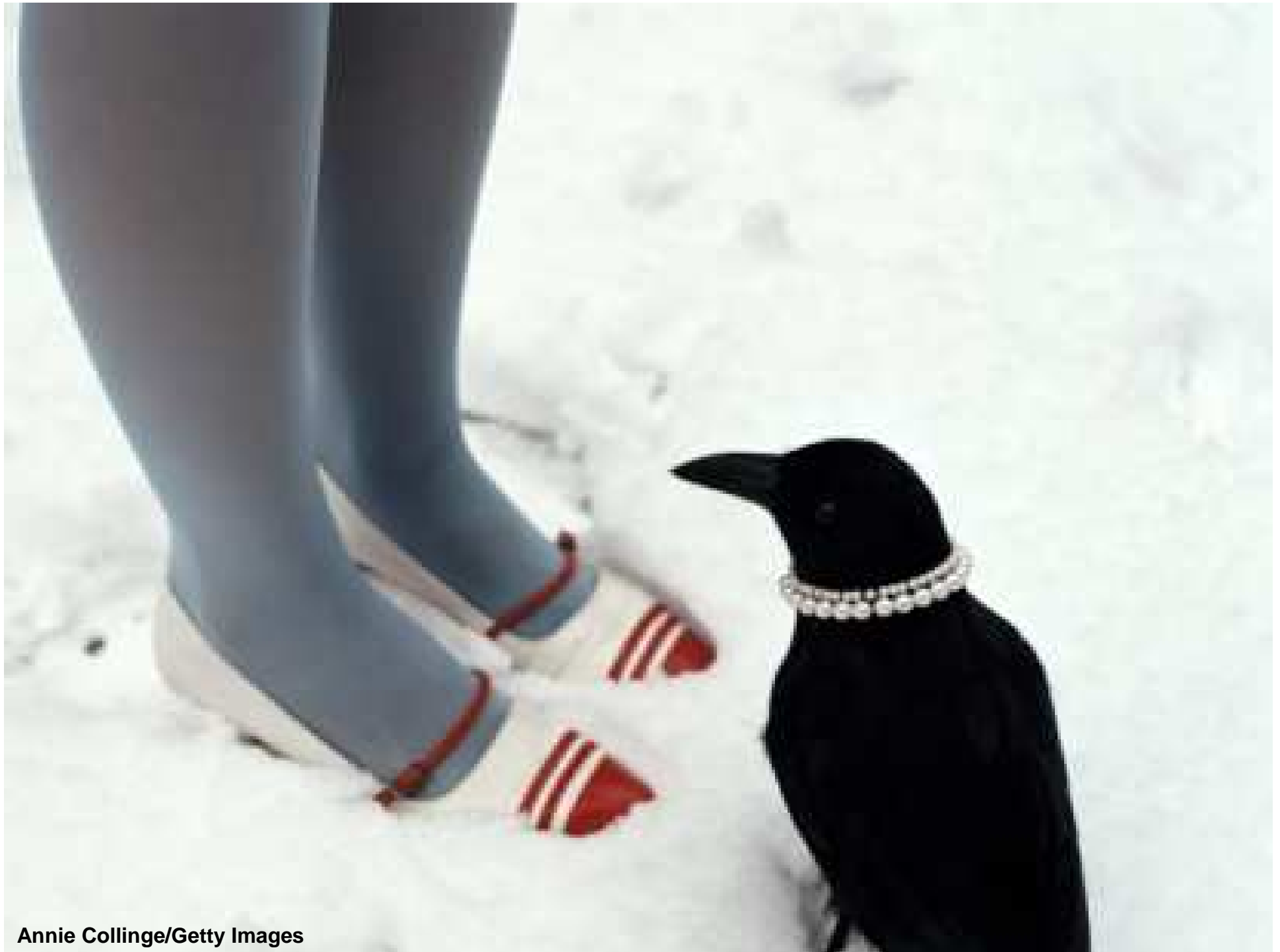
Annie Collinge/Getty Images