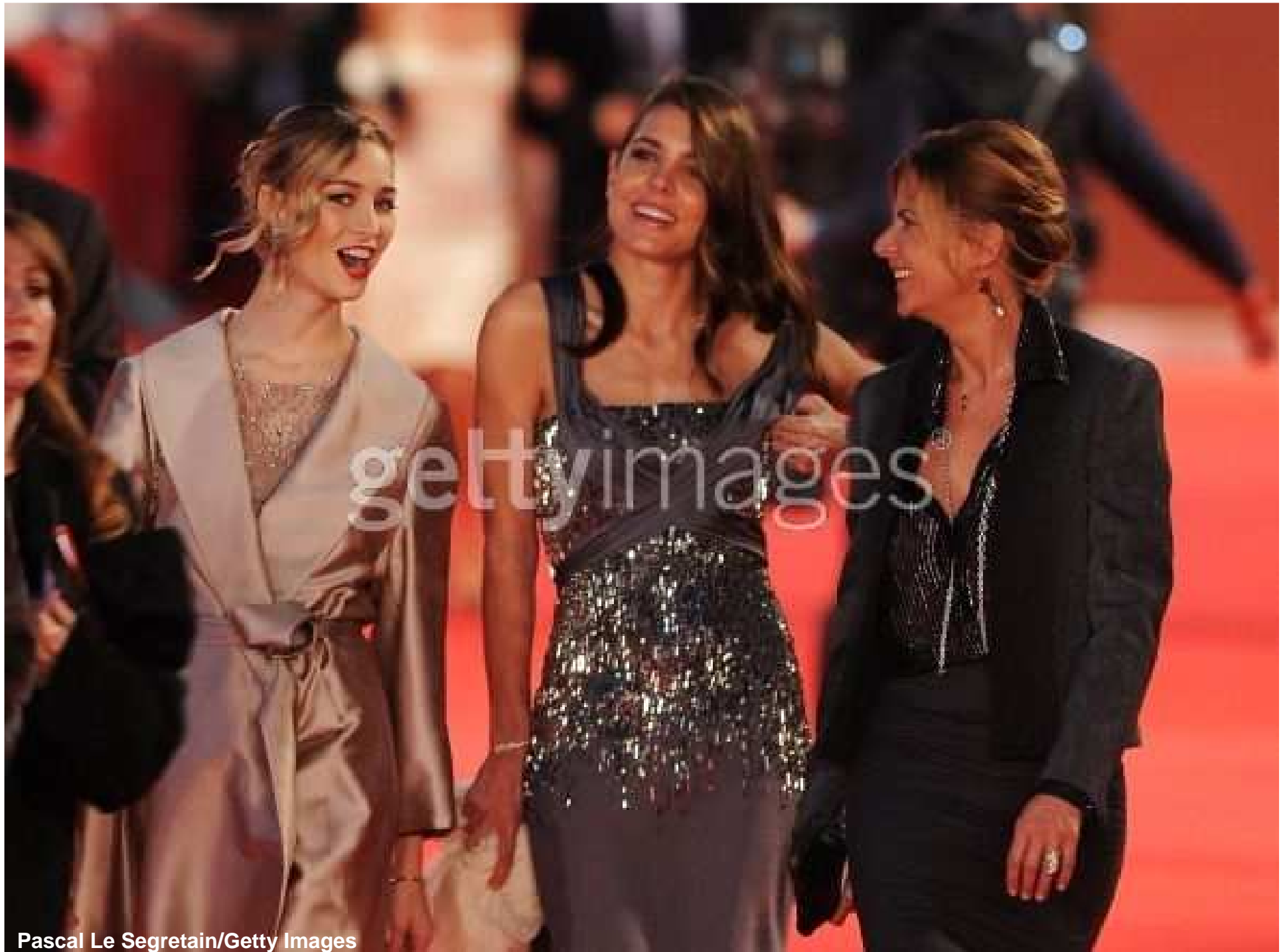
Pascal Le Segretain/Getty Images