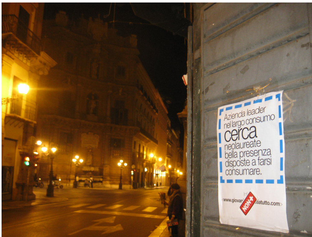
Figura 6 PALERMO/ NON+ marchia i 4 canti