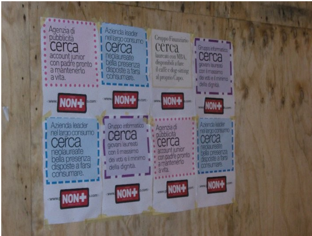
Figura 7 BOLOGNA/ locandine