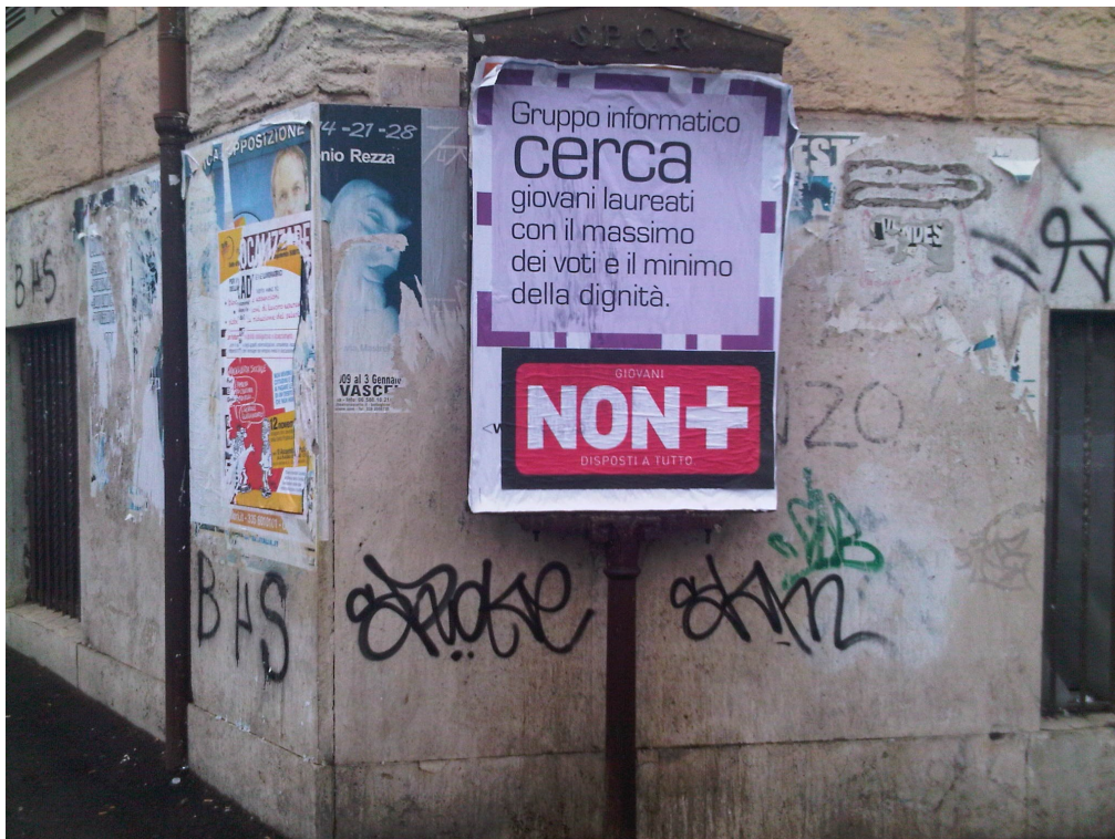
Figura 5 ROMA /viale Manzoni

3) I manifesti e le locandine vengono coperti dagli stickers e dalle fascette “NON +”