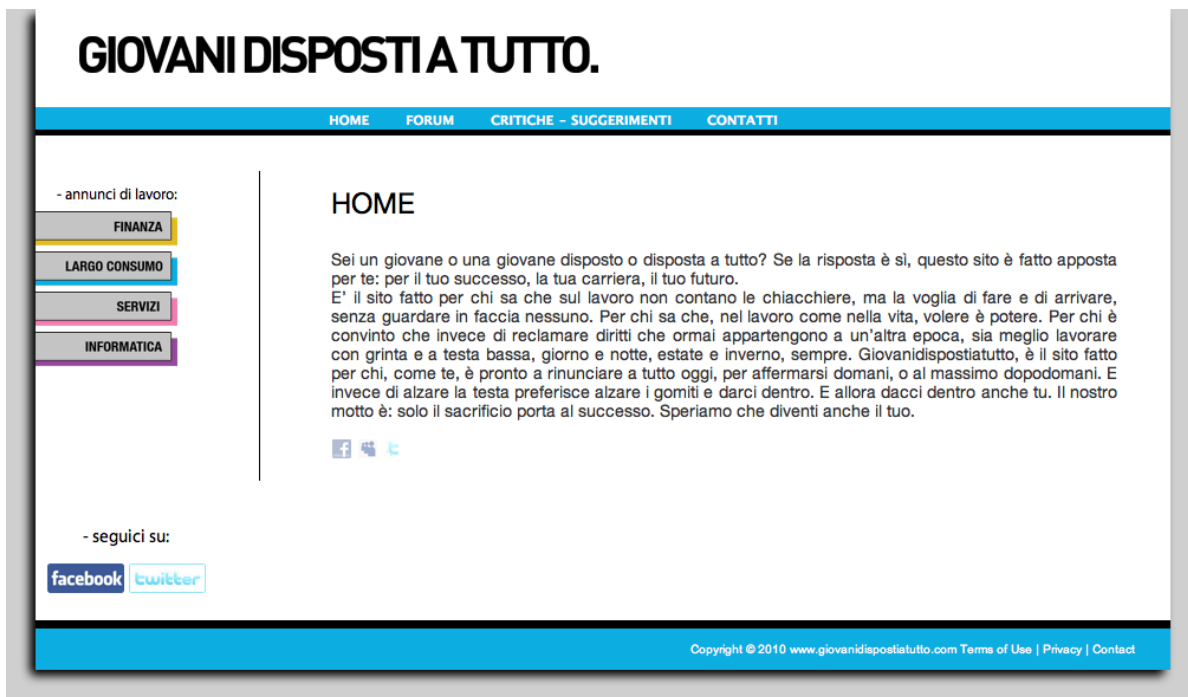
Figura 1 La pagina iniziale del sito www.giovanidispostiatutto.com