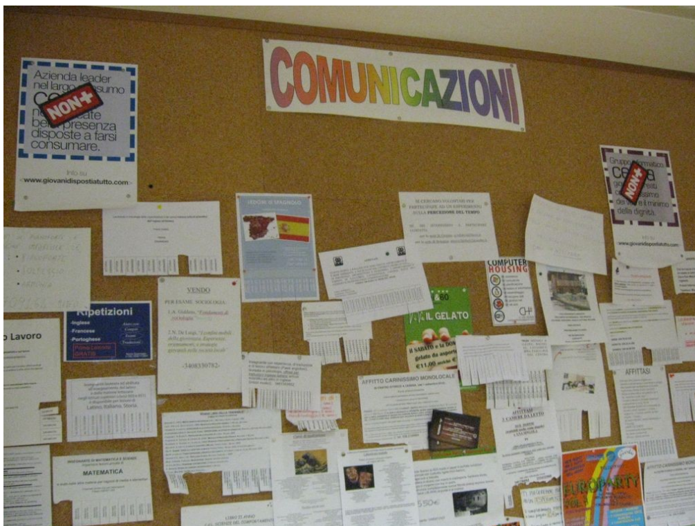
Figura 8 CESENA / bacheca