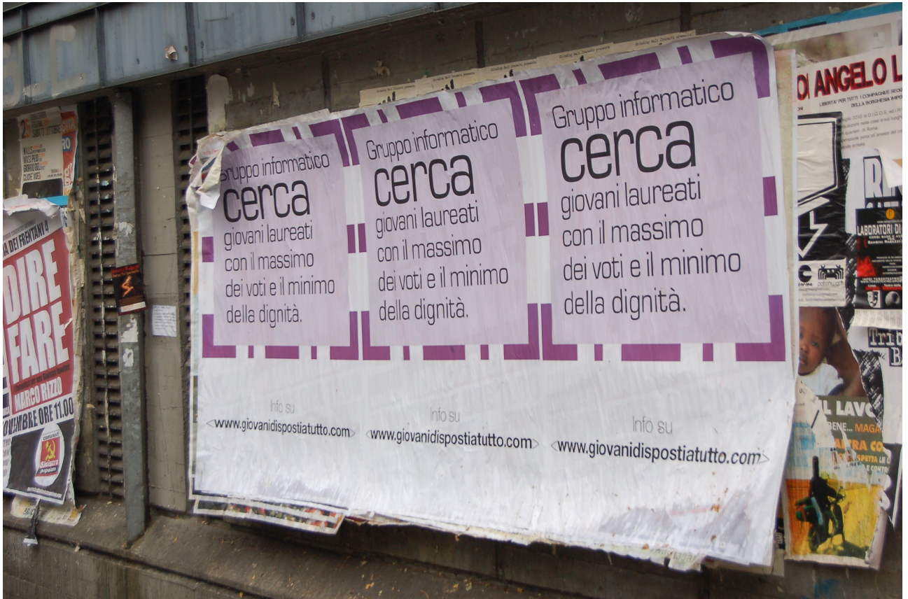
Figura 3 NAPOLI/ manifesti nel giorno della manifestazione dei precari della scuola

3) Gli annunci “indecenti” si diffondono sul web e vengono affissi nelle principali città italiane.