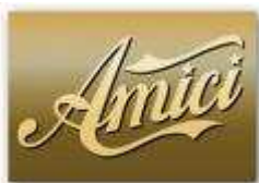
CONFRONTO EDIZIONI - FASCIA PRIME TIME

Iniziato nel 2001 con un'edizione pomeridiana su Italia 1 e con il titolo di "Saranno famosi", il talent show condotto da Maria De Filippi ha saputo guadagnarsi la prima serata sulla rete ammiraglia del gruppo Mediaset. Dal 2004 infatti, il programma è andato in onda con successo nel prime time di Canale 5 e il 29 Marzo 2010, con la vittoria della "cantante" Emma, si è conclusa la nona edizione. Gli ascolti di questa ultima stagione sono stati più bassi rispetto alla media degli anni precedenti.