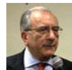
giurista e uomo d'altri tempi