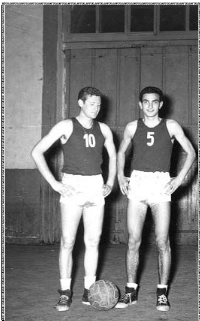
1959: I due "Pivot" della Scandone