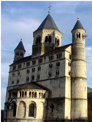
De Collegiale Sainte Gertrude van Nijvel

De stad ontstond rond een adellijke abdij in de tijd dat het christendom vaste voet kreeg in ons land. De abdij herbergde een dubbelorde die bestuurd werd door vrouwen, iets dat vrij uitzonderlijk was in Europa. Het geheel toont een uitzonderlijke architectuur: de Romaanse abdijkerk uit de XIe eeuw, de ondergrond met de archeologische ontdekkingen, de crypte, de kloostergang, de westbouw, en de schatten uit de periode van de XIIe tot de XIIIe eeuw. Onder de Karolingers werd de instelling een keizerlijke abdij. Later werd ze een halteplaats langs de bedevaartweg naar Compostella.