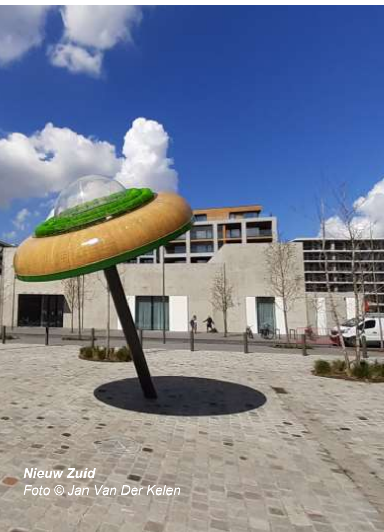
Nieuw Zuid

Aan de boorden van de Schelde op de plek waar o.a. een groot spooreplacement was, groeit een stad in de stad. Het Nieuwe Zuid wordt een groen stadsdeel met extra aandacht voor duurzaamheid. Tegen 2025 zijn hier 2000 wooneenheden in een groene omgeving verbonden door een warmtenet. Grote architectenbureaus tekenen voor de invulling: Robbrecht en Daem, Polo Architects, Stefani Boeri, C.F. Möller en Bruut... Galerijen en horeca vonden al de weg. Wat een wadi is en hoe die vliegende schotel daar komt. Dat komt u ook te weten in deze toer.