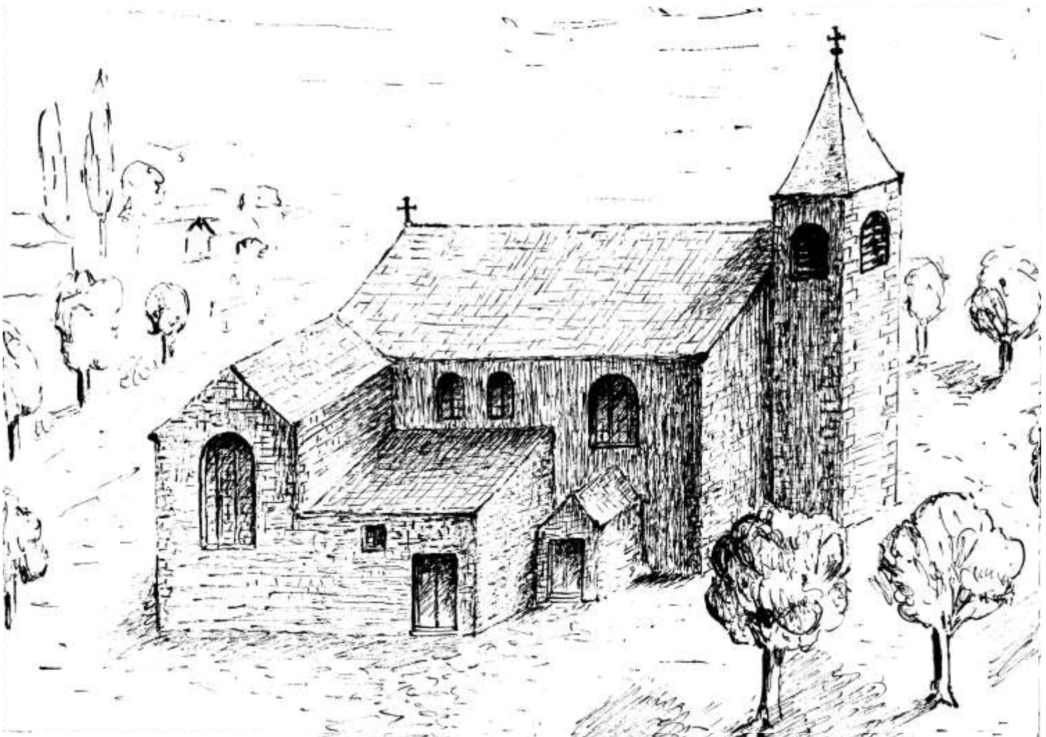
De Bergkerk in het jaar 1713. Naar een pentekening van Jozef Werbrouck.