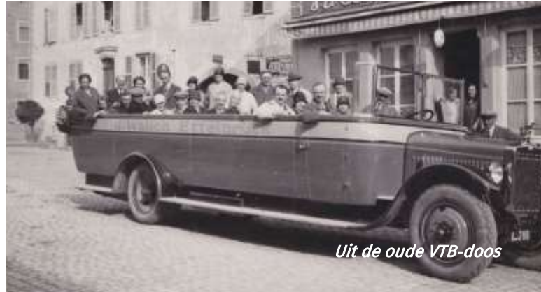
Uit de oude VTB-doos

Deze tentoonstelling over de oorsprong en de evolutie van VTB zal inzicht geven in de geschiedenis van het toerisme in Vlaanderen. Daarnaast zal ook de diversiteit van toeristisch erfgoed in de kijker staan. Ook het verhaal van duizenden mensen die via de vereniging hun eerste stappen zetten als toeristen komt uitgebreid aan bod. Het wordt een expo voor een breed publiek boordevol getuigenissen, verhalen, foto- en filmmateriaal uit ons (kleur)rijk archief.