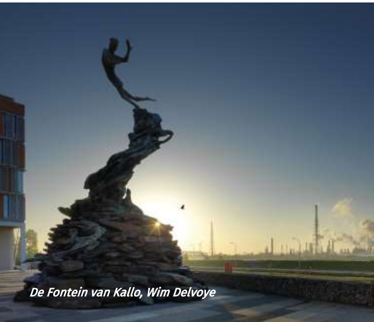
De Fontein van Kallo, Wim Delvoye

De rondleiding op de site Singelberg gaat volledig in openlucht door.