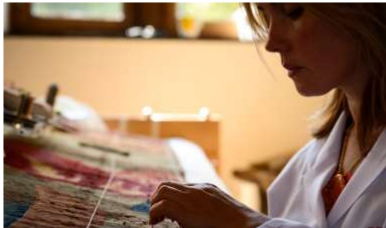
Restauratie van wandtapijten

Op 14 juni 2002 werd het Sint-Angela-Instituut en het klooster van de zusters ursulinen met de ommuurde kloostertuin beschermd als monument. De artistieke waarde van de art-nouveaufeestzaal was een belangrijk argument in dit dossier. In 2007 verlaten de laatste zusters het klooster. De school in Tildonk blijft wel gewoon voortbestaan, nu als externaat.