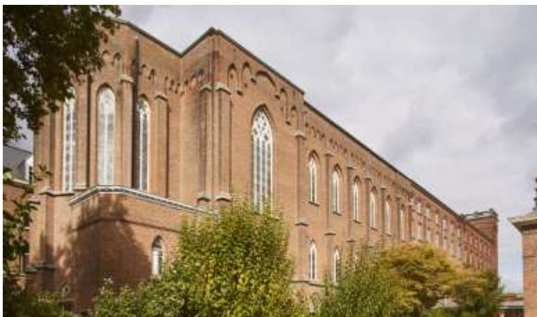
Sint-Angela-instituut en -klooster