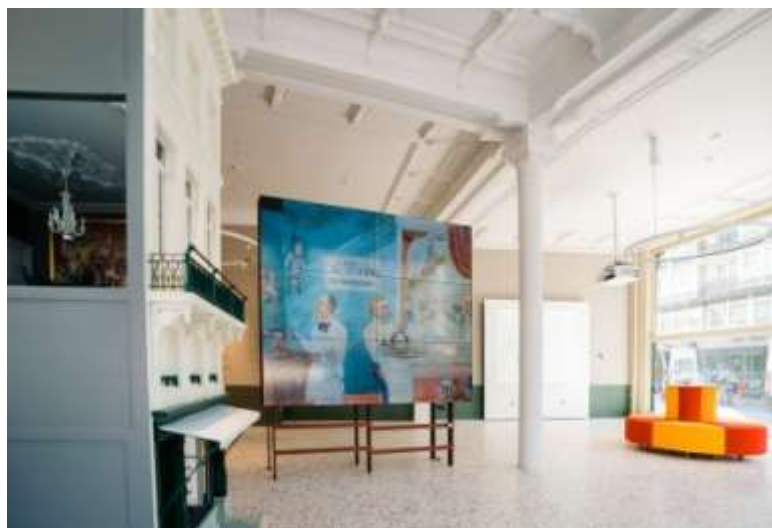
Het vernieuwde James Ensorhuis

De triënnale voor hedendaagse kunst aan zee streeft ernaar de huidige tijd historisch te benaderen. Onze blik op het verleden is doordrongen van eenzijdige denkbelden en ouderwetse ideeën. Een zienswijze waar echter vele stemmen ontbreken en de mens zichzelf oppermachtig waant. De kunstwerken laten uitgewiste stemmen wél aan het woord, met aandacht voor alles dat leeft, en binnen een bewustwording van de kwetsbaarheid van de mens in het ecosysteem. De sculpturen van Beaufort 21 vormen op die manier gedenktekens van een andere aard, beter passend bij het huidige tijdperk.