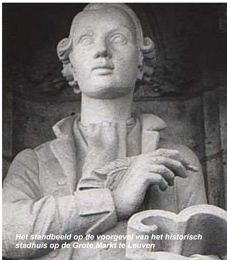
Het standbeeld op de voorgevel van het historisch stadhuis op de Grote Markt te Leuven