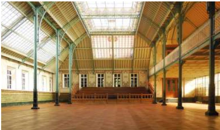
De indrukwekkende art-nouveaufeestzaal