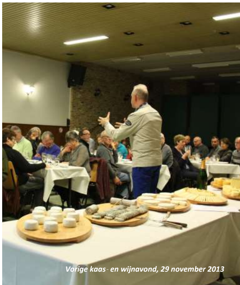
Vorige kaas- en wijnavond, 29 november 2013